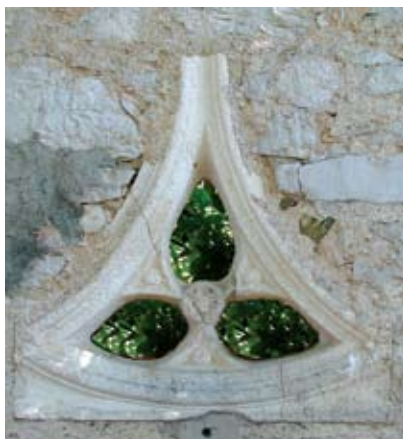
Dio bifore uzidan u vrtu palače Lode u Bolu