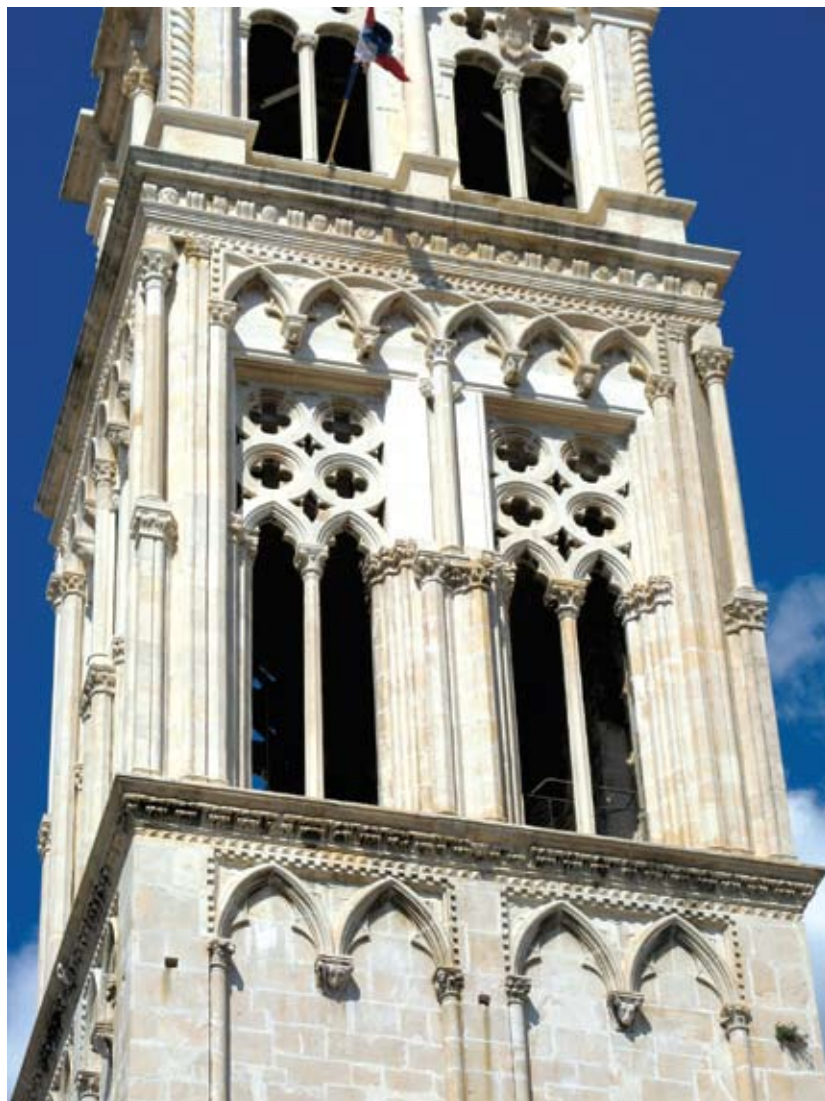
Kasnogotička mrežišta na drugom katu trogirске katedrale

poredbu s istaknutim primjerima arhitektonske plastike. Po jednostavnosti i stilu ukrasa blizak je biforama iz kaštela u luci u Bolu 11 , jednom od rijetkih primjera gotičke stambene arhitekture na Braču.