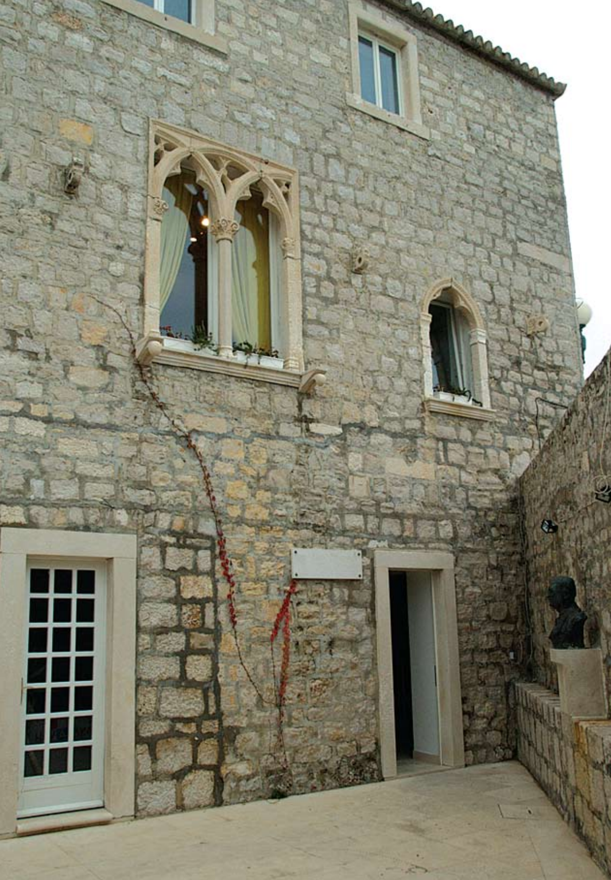
Gotički kaštel u Bolu