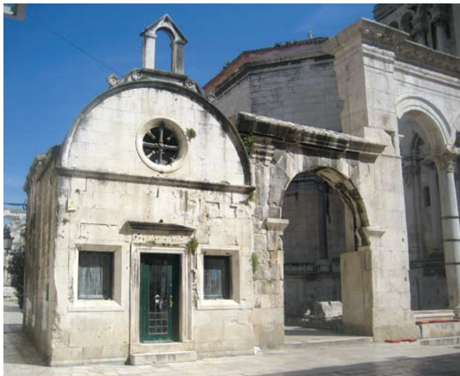
Crkva sv. Roka na splitskom Peristilu

kom ili gotičko-renesansnom slogu. U južnom zidu crkve nalaze se elementi trijema glavne kasnoantičke ulice Dioklecijanove palače u smjeru istok-zapad ( decumanus maximus ). Niz elemenata započinje sjevernim pilonom završnog luka istočne kolonade Peristila, a sastoji se od okomito i horizontalno postavljenih arhitravnih greda. Crkva sv. Roka prošla je više graditeljskih faza što upućuje na mogućnost o sakralnoj namjeni objekta i prije 1477. godine.