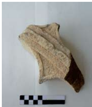
Fragment kasnogotičkog mrežišta iz crkve sv. Roka

Na istočnom kraju dijela poda s grobnim ukopima nalazi se niz kamenih ploča žućkaste boje koje bitno odudaraju od ostatka poda izrađenog od kamenih ploča sive boje. Time je vjerojatno prostor podijeljen na veći zapadni, sepulkralne namjene, i manji istočni, sakralne namjene. U istočnom dijelu nije bilo grobova već je pronađeno samo renesansno popločanje crkve. Osim nalaza, uz južni zid crkve vidljivo je i nekoliko sačuvanih in situ originalnih ploča trijema antičkog dekumanusa, na kojima stoji južni zid crkve, te ostatak temelja zida s kasnije probijenim otvorima, koji su povezivali crkve sv. Roka i sv. Sebastijana.