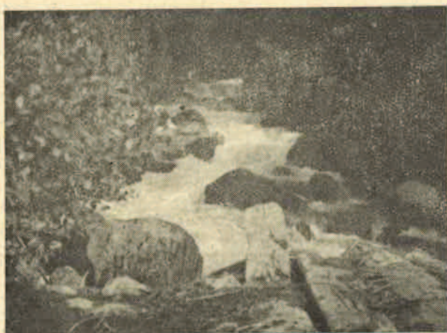
Kaluđerska reka ispod sela Štrpce

Po svojim prirodnim lepotama Šara planina je nadaleko poznata. Na svojim plećima ona nosi mnogobrojne planinske suvati sa kojih vredni čobani napasaju svoje stado. I šume su bogate divljači, ali biser ove planine su njeni mnogobrojni potoci i reke koji izviru iz kamenitih uvala i kroz kamenito i stenovito korito hitaju u doline ka Vardaru i Belom Drimu. O njihovoj lepoti i bogatstvu je malo pisano pa su one malo poznate. Upoznaćemo vas sa Lepencem i njegovim pritokama koje su za ribara najlepše i najinteresatnije.