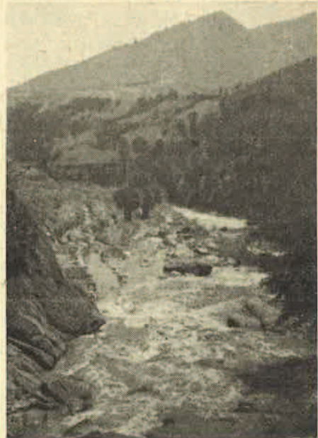
Reka Lepenac kod sela Brod

Nažalost pored napred pobrojanih voda Lepenac ima još mnogo pritoka naročito sa njegove leve strane, no nažalost danas njih više ne naseljava pastrmka pošto su nakon uništavanja šuma pretvorene u prave bujice u kojima više nema uslova za