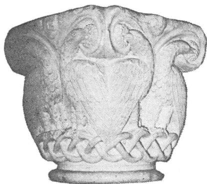
Romanički kapitel iz Kreševa

u prvim godinama XII stoljeća, što u Bosni počinje podgrijavati nastojanja za samostalnošću. Podlaganje Duklji, zatim vlasti mađarskih kraljeva, te — konačno — Bizantu, a sve to u prvih osam decenija XII stoljeća, izaziva, možda, povremene nemire, između kojih su ipak mogli nastupiti i intervali pogodni za podizanje reprezentativnih građevina. Konačno je i Kulinova vladavina oko 1180. do 1204. godine mogla pružiti podstreka za veću građevinsku djelatnost. Skroman dokaz za to je crkva u Muhašinovićima (Biskupićima) kod Visokog. 24