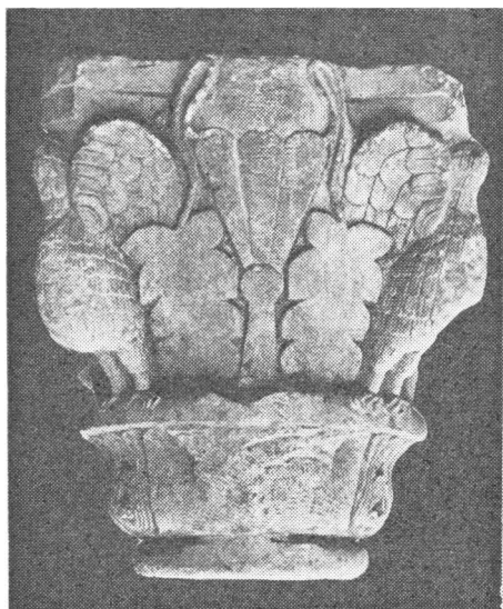
Romanički kapitel iz Kreševa

sanskog biskupa kao splitskog sufragana. 21 Benediktincima je tada, makar i za kratko vrijeme od dvadesetak godina, bio otvoren put u Bosnu. Ciborij iz Rogačića 22 i doprozornik s grada Sokola na Plivi 23 vjerojatno pripadaju u to doba. Taj razvoj je onda prekinut prodorom Arpadovića prema Jadranu