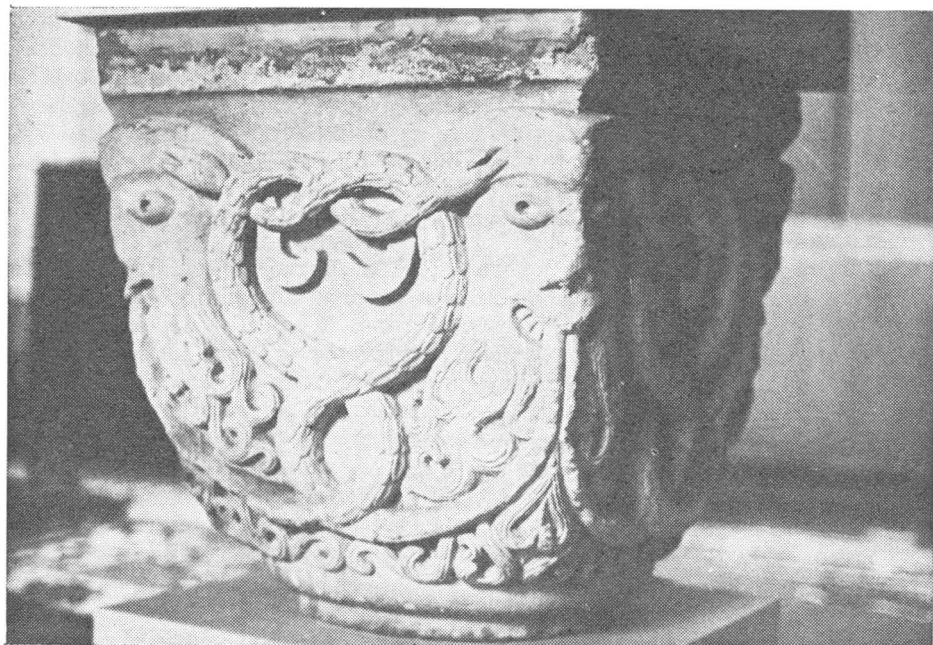
Romanički kapitel iz Kreševa

Ostat će tajna odakle je sve Kujundžić uzimao kamen za gradnju. Prema Strukiću, on je osim stećaka iz Polja uzimao i kamen iz majdana u Mratinićima. Međutim, u Polju, zapadno od sastava Hrmze i Ljuskave, a prema Kreševčici, nalazile su se još u XIX stoljeću ruševine nekog naselja i jedna građevina vrlo debelih zidova. Po tradiciji to je bilo staro Kreševo s gradskom crkvom. 5 I otuda su mogli potjecati ti kapiteli.