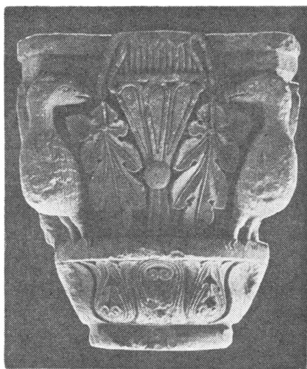
Romanički kapitel iz Kreševa

dok je br. 3 na dvije plohe ostao zanemaren, pa se čini da je stajao u sredini neke bifore. Kapiteli potječu iz iste radionice, pa su se, bez sumnje, nalazili i u istoj građevini.