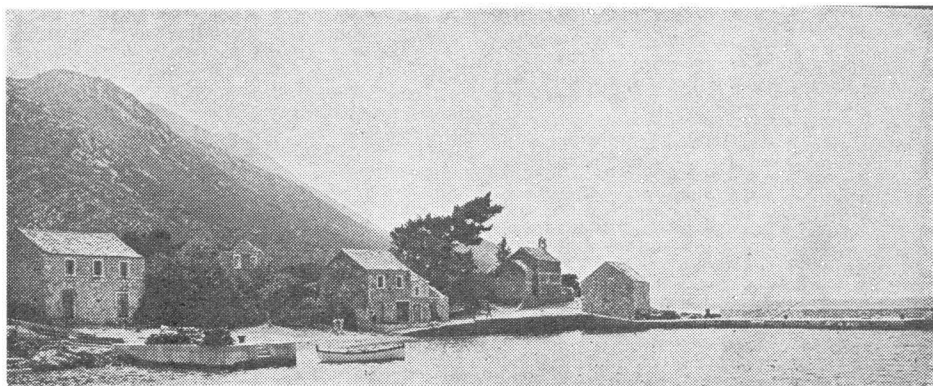
Pogled na Dubu Trpanjsku

Ta stambeno-gospodarska cjelina vrlo razvijenog tlocrta, koji vješto spaja unutarnji s vanjskim natkrivenim i otvorenim pratećim prostorom, predstavlja kvalitetan primjer seoskog baroknog 4 objekta, čiji su dvojnici u urbanim prostorima dubrovačkog područja vrlo česti. 5