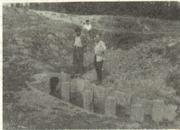
Ribnjak Lukavec I. Postavljeni stupci za uređaj automatskog ribolova

bilnoga uređaja riba sama dolazi automatski na ribarski stol. Ipak je i postavljena mreža znatna pomoć za daleko povoljniji način ribolova tamo, gdje