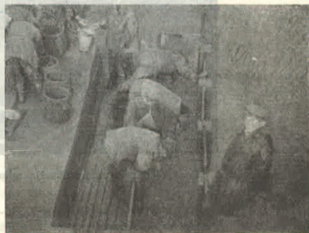
Ribolov na Varaždin-Bregu, ugrađen ribarski stol

— Manipulacija ribom je mnogo pojednostavljena, riba ne trpi od stezanja ili povlačenja po mulju, te nema zaostale ribe ispod mreže, donjaka, koja se