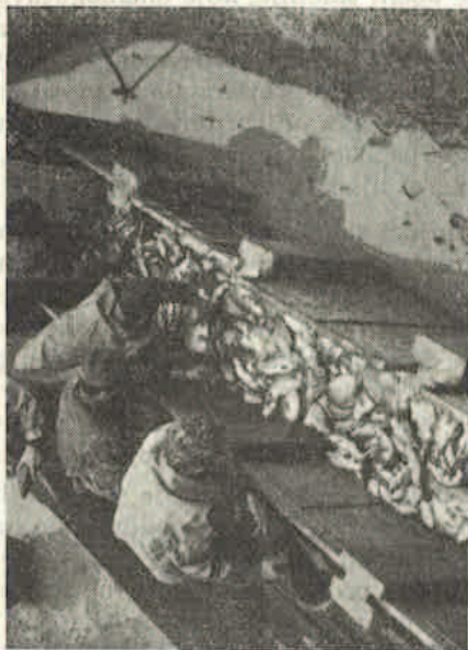
Ribolov na Varaždin-Bregu, riba na ugrađenom stolu

Ribolov se obavlja u kasnu jesen, prije nastupa zime ili u rano proljeće. Dakle u vrijeme, kada nije prijatno raditi sa ribom u vodi na raskvašenom terenu, često uz loše vremenske prilike. Ribolov se vrši na uobičajen način, povlačenjem ribolovnih mreža po kanalima, u koje se slegla riba. U dobro izgrađenom ribnjaku sav posao ribolova koncentriran je na jednom mjestu. Na najnižem dijelu ribnjaka, pred izlaznim grljenjakom, sakupljena je sva riba u zadnjem ostatku zamuljene vode. Za ribolov se traži naročita ribarska oprema i kvalificirani kadar ribarskih radnika, opremljen za taj rad u vodi