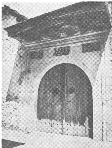
Kuća Muhameda Muslibegovića iz 1871. g. u Mostaru