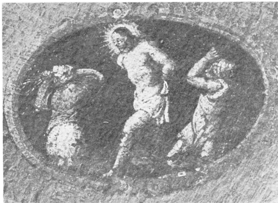
Baldassare D'Anna, Bičevanje sa slike Gospe Ruzarija u župskoj crkvi u Gornjem Humcu

plavi, zeleni i smeđi tonovi, dok je crvena boja potpuno ugašena u svojoj kromatskoj vrijednosti. Nema u toga slikara osjećaja za detalj koji bi oživio cjelinu ili individualizirao fizionomije. Ruke su mrtve, lica odsutna i beživotna. Ukočeni stav sv. Franje je nespretniji od onoga na pali u Nerezinama 12 i Martišćici 13 gdje je prikazan u pokretu, te onog u Pagu, 14 bezizražajnog duguljastog lica uokvirenog bradom. U usporedbi s likom s paške pale i sv. Dominik je tvrdi i bezizražajniji. 15 Kod modeliranja lica sv. Hijacinta pokazao je Baldassare više osjećaja za detalj naglašavajući svečeve oštre crte i orlovski crveni nos, ali uspoređen s istim likom na pali u Starom Gradu 16 nedvojbeno je slabiji u izradi. Lik Karla Boromejskog je rađen u okviru uobičajene svečeve tipologije, 17 visokog čela, izražene brade i podignutog pogleda, ali modelacija je oštra i tvrda bez mekih prijelaza svjetla i sjene. Koloristički kontrast bijele albe i crvene mocete nije iskorišten ni oživljen, što bi sigurno oživjelo i dalo akcent cijeloj kompoziciji. Nezgrapna i bezlična Bogorodica okruglog neizražajnog lica, širokih bademestih očiju i malih punih usana nalazi se unutar Baldassarine tipologije, dok Dijete položajem slični na ono s pale sa sv. Katarinom sienskom u Starom Gradu 18 ali je sa svojom zlaćanom kosicom i punačkim tijelom mnogo ljupkije. Anđeli koji krune Bogorodicu slični su onima na pali u Pagu, 19 jer