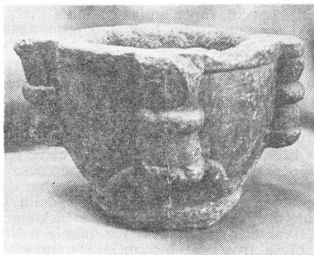
Renesansno-barokni mortar iz Trogira

Ratne su okolnosti nametnule da se crkva Sv. Nikole napusti, a ujedno i svetište Sv. Barbare, pa se štovanje te svetice prenosi u crkvu Sv. Martina usred grada. C. Cega navodi 1537. godinu kada je oltar sv. Barbare prenesen u crkvu uz gradsku ložu. 20 Međutim, u aktima vizitacije biskupa Didaka