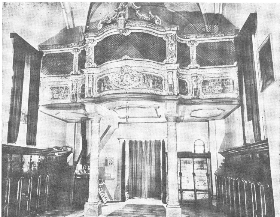
Pjevalište u unutrašnjosti crkve u Savini

sigurno je da su oni usmerili Nikolu Foretića da projektuje građevinu koja će svojim kubetom ispoljiti duh pravoslavne umetnosti. Kada je to postignuto, ostali sklop ove građevine mogao je da bude pozajmljen sa raznih strana.