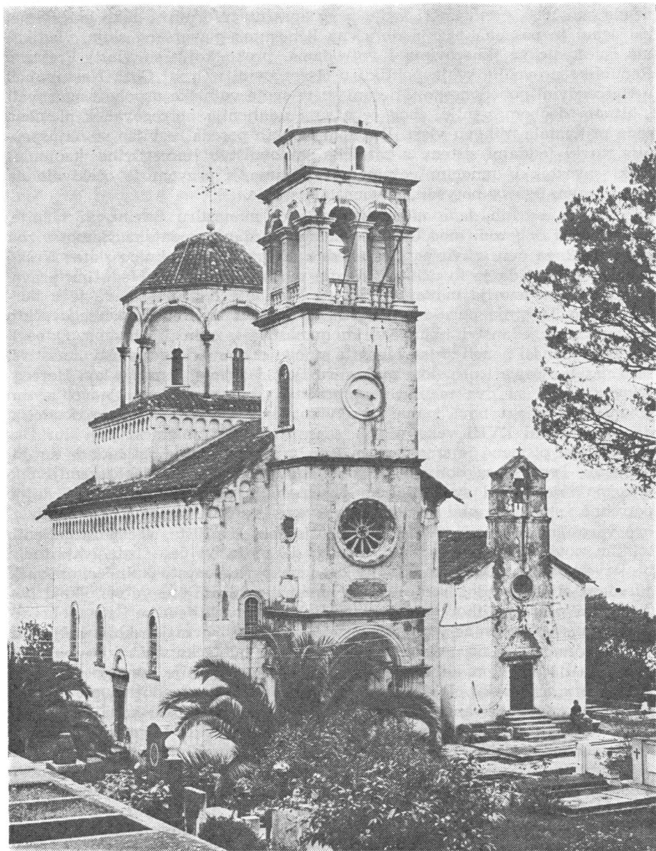
Manastir Savina