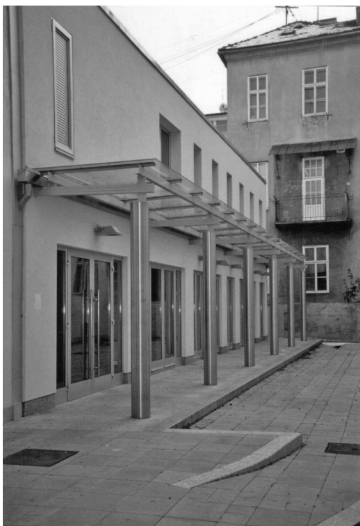
Dvorišna zgrada MH, ulaz