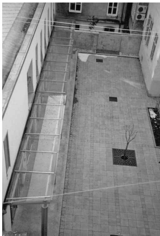
Dvorišna zgrada MH, pogled odozgo na ulaz i dvorišni dio

Posvemašnja jednostavnost dvorišnih pročelja Matičine palače odredila je miran i jednostavan ton u oblikovanju vanjštine nove dvorišne zgrade, podalje od bilo kakva pretjerivanja.