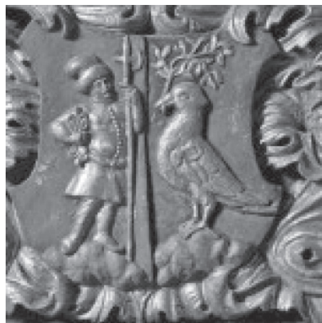
Johannes Komersteiner, detalj ornamenta