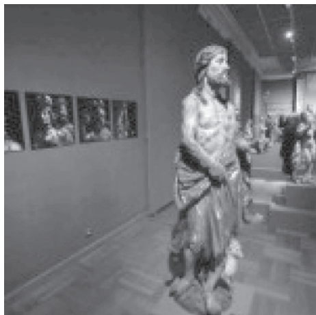
S izložbe u MUO (detalj)

Dalje, Komersteiner afirmira novu, posve baroknu skulpturalnost ljudske figure koju određuje jaki kontrapost i uz tijelo usko pripijena, draperija koja poput "druge kože" odražava građu tijela svetačkih likova, posvjedočujući tako, uz izražajne fizionomije lica ne samo talent, nego i iznimnu količinu truda i mara koje je Komersteiner ulagao u oblikovanje svojih skulptura i reljefa.