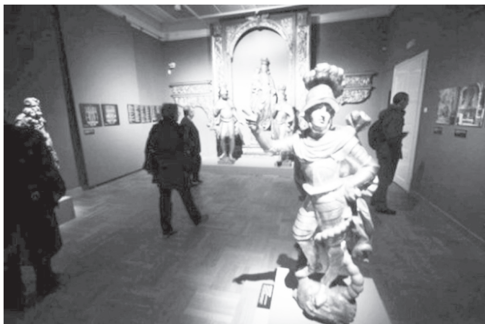
S izložbe u MUO (detalji)