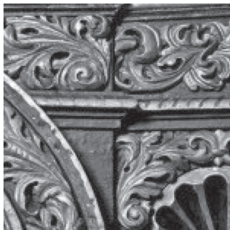
Johannes Komersteiner, detalj ornamenta

Komersteiner u Zagreb nakratko dolazi na poziv tada elitnog reda isusovaca za koje 1676. izvodi kameni kip svetoga Franje Ksaverskog u njihovoj crkvi svete Katarine na Gornjem Gradu, no tom kipu danas nema ni traga. U sljedećem desetljeću, nakon trajnog preseljenja u Zagreb, Komersteiner izrađuje spomenute veličanstvene oltare sv. Marije i sv. Ladislava (1687.-90.) za Zagrebačku prvostolnicu, za koju izrađuje i oltar sv. Emerika čije dijelove je također moguće vidjeti na izložbi u Muzeju