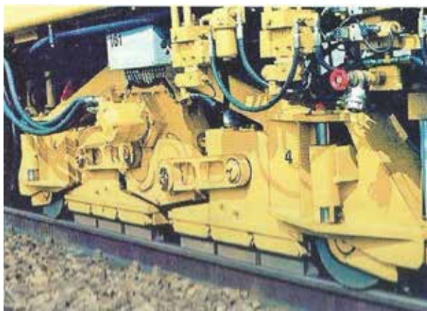
Slika 7. Stroj za brušenje tračnica

Nakon brušenja glave tračnice s vremenom se pojavljuju sitna oštećenja vozne površine koja se manifestira u raznim oblicima, primjerice kroz nastanak utora na glavi tračnice, otpadanja malih dijelova glave tračnice, oštećenja zbog pokretanja vlakova na usponima i kočenja. Njih je moguće eliminirati obradom vozne površine tračnica navarivanjem.