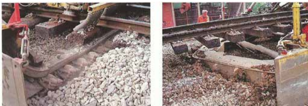
Slika 5 i 6. Stroj za pročišćavanje (rešetanje) zablacene zastorne prizme

Strojno pročišćavanje zastorne prizme (rešetanje) obavlja se zbog zablacenja prizme tijekom eksploatacije. Razni su čimbenici koji utječu na zablacenje, a kreću se od lošeg stanja donjeg ustroja, preko raznih atmosferskih utjecaja koji nanašaju nečistoću do neispravnih vagona iz kojih se prospava rastresiti teret. Nečistoća se pojavljuje i pri lošoj kvaliteti tučenca s obzirom na tvrdoću te djelovanjem ostalih konstruktivnih elemenata gornjeg ustroja ako su postali neispravni tijekom eksploatacije pruge.