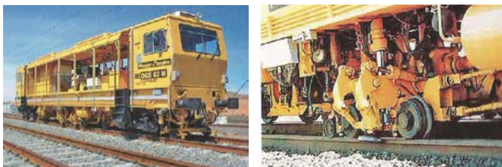
Slika 1. i 2. Stroj za strojno reguliranje (dinamičko stabiliziranje) kolosijeka

Strojno reguliranje kolosijeka je nužnost održavanja ispravne geometrije kolosijeka. Pogrešna je bila praksa potpunog tretiranja pruge. Potrebno je strojno regulirati samo one dijelove koji se mjerenjima pokazuju lošima i koji se samim tim mogu poboljšati. Dobri dijelovi se ne trebaju regulirati jer ih se može učiniti samo lošijim.