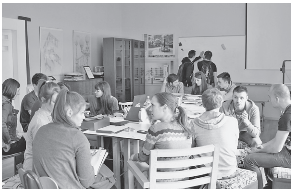
Slika 3. Atmosfera u učionici za dizajn – timski rad studenata Drvne tehnologije i Studija dizajna na kolegiju Oblikovanje namještaja