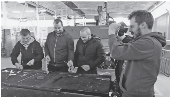
Slika 10. Posjet tvrtki Bokart