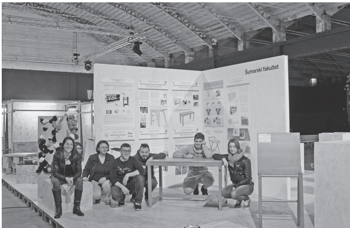
Slika 8. Izložbeni prostor Šumarskog fakulteta u Haubi – zadovoljni studenti i mentorice nakon dobro obavljenog posla

No uz sve iznimno pohvalne tekstove novinara objavljene u časopisima i tv emisijama te uz izjave o uspjesima naših studenata na Facebook stranicama,