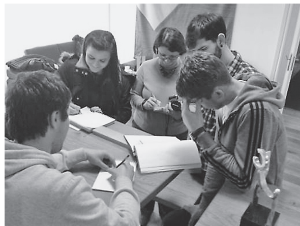
Slika 6. Istraživački rad grupe studenata na projektu Učionica 202

U sklopu suradnje s Drvnim klasterom Slavonski hrast prototipove dvaju odabranih rješenja – višefunkcionalnog stola za Vijećnicu DTO-a (rad studenata V. Slivara, L. Beline, I. Ražova, sl. 7.) te radnog stola za računalnu učionicu (rad studenta V. Slivara) – od hrastovine je izradila stolarija Špurga d.o.o iz Županje.