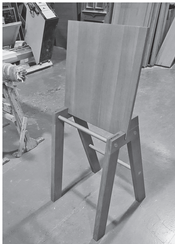
Slika 7. Prototip višenamjenskog stola izraden u stolariji Špurga d.o.o.