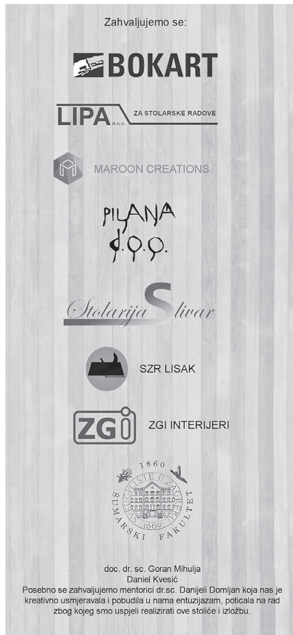
Slika 12. Zahvala grupe Enable table na poledini letka za TDZG

Sutlić, K.: Od stolaca i lampi do Nordijske kuće, Jutarnji list , prilog „Kultura“, 4. svibnja 2016.; http://