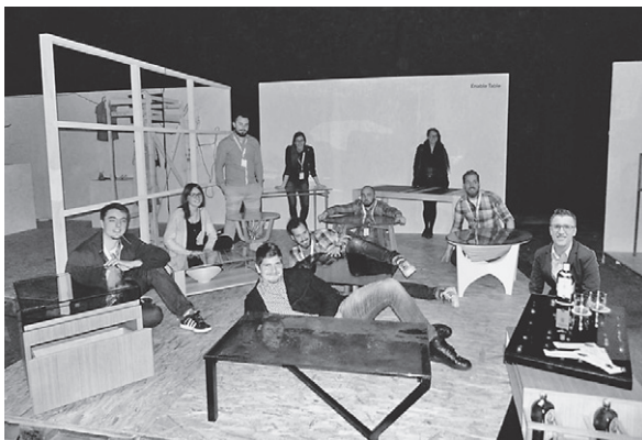
Slika 11. Grupa studenata Enable Table na izložbenom prostoru Expoa u Haubi

iskreno, ništa nas ne ispunjava većim ponosom od teksta zahvale angažiranim tvrtkama i osobama koji je objavljen na letku Enable Tablea (sl. 12.).