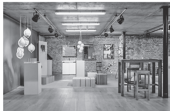
Slika 2. Izložba namještaja u Laubi – postav Zajednice za industrijski dizajn HGK-a