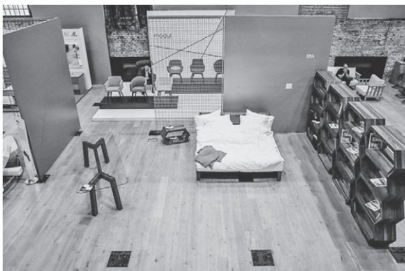
Slika 1. Impozantna Lauba : izložbi dizajnerski orijentiranih proizvođača, dizajnera i trgovaca namještaja

Petnaestak četvornih metara izlagačkog prostora Šumarskog fakulteta zauzeli su nastavni projekti koji su se provodili u akademskoj godini 2014./2015. na preddiplomskom studiju Drvne tehnologije (izborna skupina B) te na diplomskom studiju Oblikovanje proizvoda od drva. Sinergija kreativnosti, poznavanja svojstava materijala, načelâ oblikovanja i konstruiranja