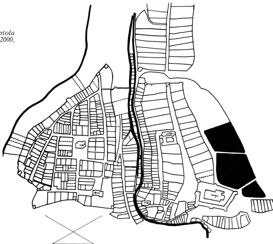
2 Parcelacija Gornjeg grada i Kaptola u 18. stoljeću (skica u mjerilu 1 : 2000, izradio autor članka)