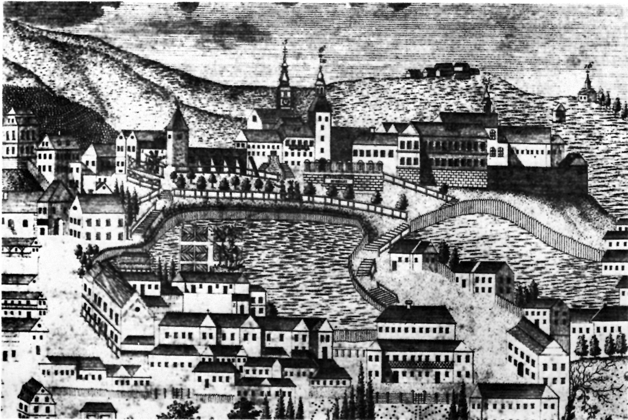
3 Detalj sa Szemanove karte iz god. 1822.