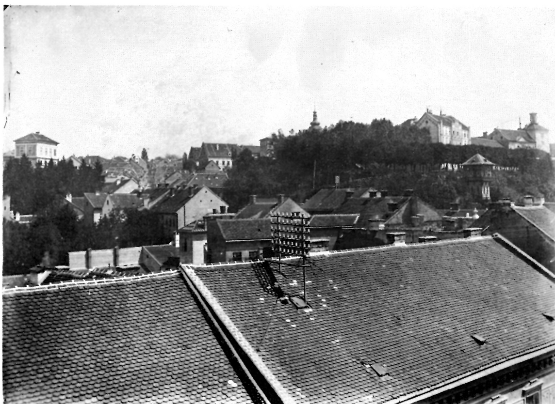
5 Pogled na Jugozapadni dio Gornjeg grada oko 1900.

»Prvi i osnovni opći konzervatorski cilj zaštite, očuvanja i revitalizacije najstarije povijesne jezgre Zagreba zasniva se na činjenici i spoznaji da se radi o jedinstvenoj spomeničkoj i povijesnoj cjelini koja upravo u svom totalu predstavlja kao cjelina spomenik kulture najviše kategorije« 2 .