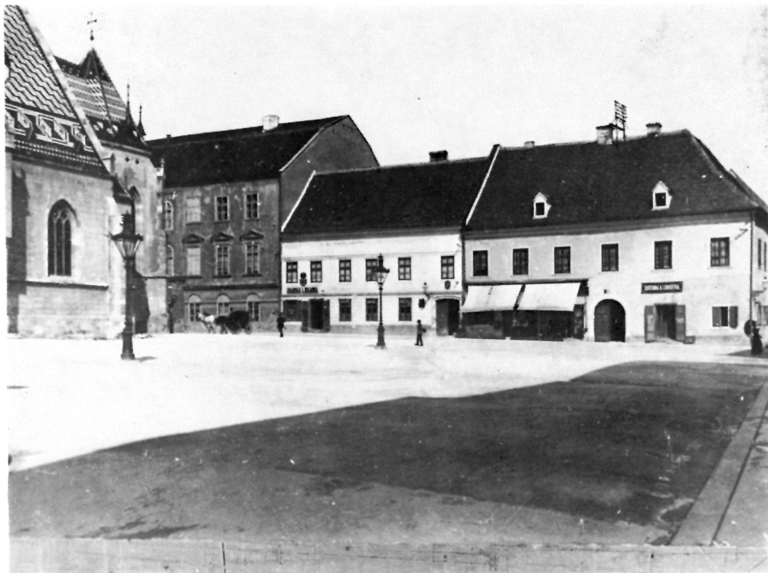
8 Radićev trg u Zagrebu (istočna strana), oko 1900. g. (Muzej grada Zagreba)

(sl. 4). U tom smislu na južnoj se fronti Gornjeg grada osim novooblikovanog Strossmayerova šetališta formira potkraj 50-tih godina 19. st. na mjestu nekadašnjeg kapucinskog vrta javno šetalište na Griču (sl. 5).