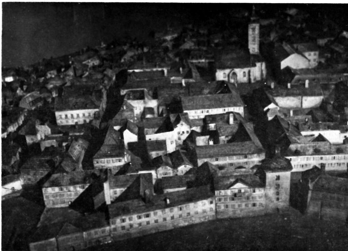
9 Maketa Gornjeg grada izrađena 1925. g. (Muzej grada Zagreba)