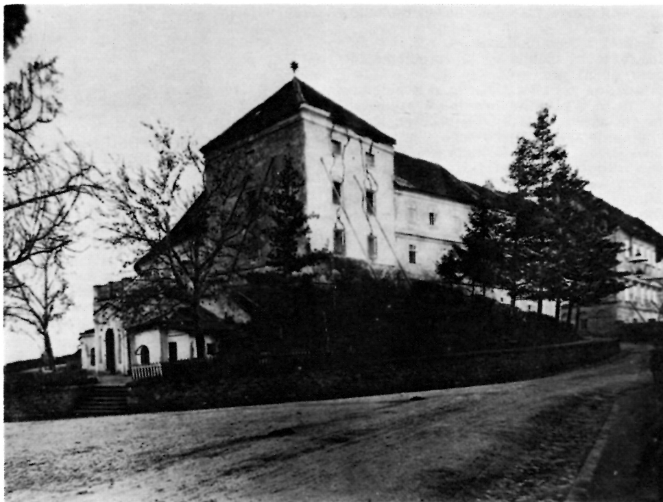
Kompleks Opatičke ul. 22 neposredno nakon potresa 1880. g.

Nakon gotovo jednostoljetnog slabog održavanja o kojem svjedoče arhivski dokumenti 15. st. 7 , zahvat 16. st. nije se ograničio samo na sanaciju oštećenog nego na potpuno osuvremenjivanje tornja za ratovanje vatrenim oružjem. Pročelja tornja organizirana su na nov način rastvaranjem puškarnica u svim etažama, diferenciranom obradom žbuke u prizemlju i katovima i artikulacijom zidova naslikanim elementima. Time je vanjština tornja dobila specifičnu kolorističku vrijednost baziranu na kontrastu bjeline zidnog platna i crvenilu naslikanih uglovnih kvadara, okvira puškarnica i vratiju.