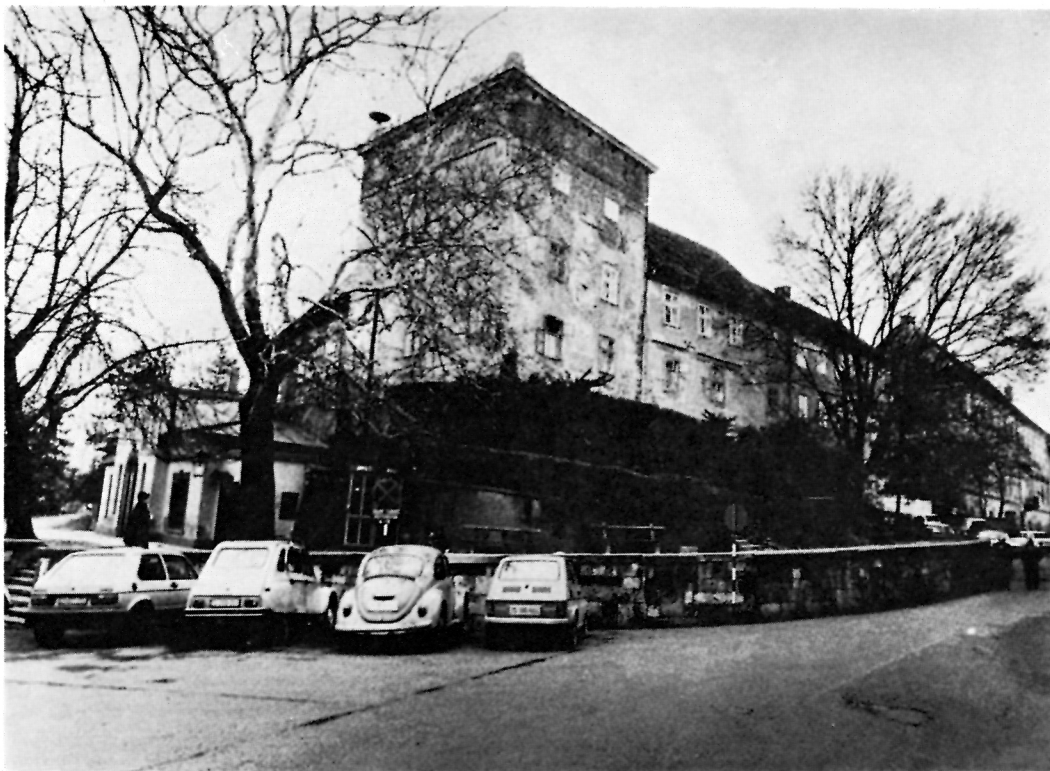
Kompleks Opatičke ul. 22 1982. g.

sa — koji je tada na vrhuncu ekonomske moći — širi se, tako da je jedno samostansko krilo protegnuto do tornja 11 . Samostan se međutim samo prislanja na Popov toranj i ne dolazi do integracije prostora jednog i drugog objekta 12 . To će se desiti kasnije, nakon ukinuća samostana i ekspanzije škole koja negdje u 18. st. ulazi u prostor Zakmardijeva spremišta 13 . Proširenje škole i adaptacija — koja se sa sigurnošću može smjestiti između 1782. i 1787. god. 14 — potpuno je prestrukturirala kompleks i stvorila kompaktan potez u koji su uključeni Popov toranj i dio bivšeg samostana. Na spremište nadograđen je drugi kat, unutrašnjost starijih objekata mijenja se izvedbom stubišta i pregradnih zidova za učionice, probijanjem vrata koja su povezala sva tri starija objekta i izvedbom svodova u svim etažama Popova tornja 15 . Vanjština kompleksa je potpuno izmijenjena te nadograđena. Škola i Popov toranj dobivaju jedinstveno tretirana pročelja rastvorena velikim prozorima i jednake detalje obrade. Dvorišno pročelje škole oblikovano je kao zatvorena ploha bez prozora samo s vratima u prizemlju koja su preostala od starijeg spremišta. Sva pročelja su iznova ožbukana i koloristički obrađena bije-