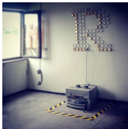
Fotografija 5. Intervencija Adnana Suljkanovića