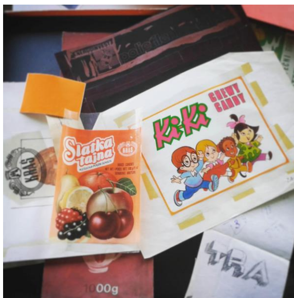
Fotografija 1.

Retrografija dizajna petodnevni je umjetnički projekt izveden u bihaćkoj tiskari savitljive ambalaže Polietilenka. Radilo se o svojevrsnoj ljetnoj školi temeljenoj na multidisciplinarnom pristupu koja je uključivala alate kustoskih praksi, grafički dizajn, fotografiju, videografiju, a bili su uključeni studenti i studentice dizajnerskih studija u Bosni i Hercegovini (Akademija likovnih umjetnosti u Sarajevu, Tekstilni odsjek u Bihaću, International University Sarajevo).