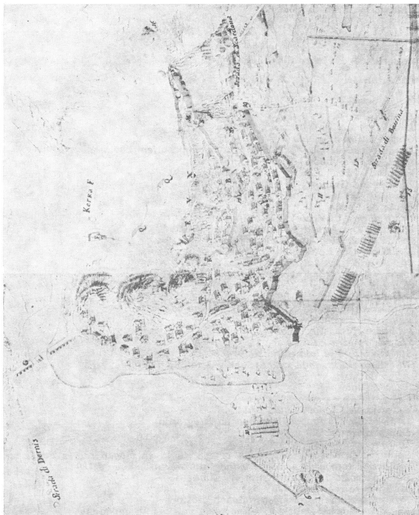
Nacrt br. 3, Detalj plana Knina iz 1688. g.

ulogu »lažnog jarka s vodom« (»Falsabraga«). Iz tog prostora ulazi se na kaštel malim vratima (N). S južne su strane vrata (M) za ulaz u kompleks kaštela.