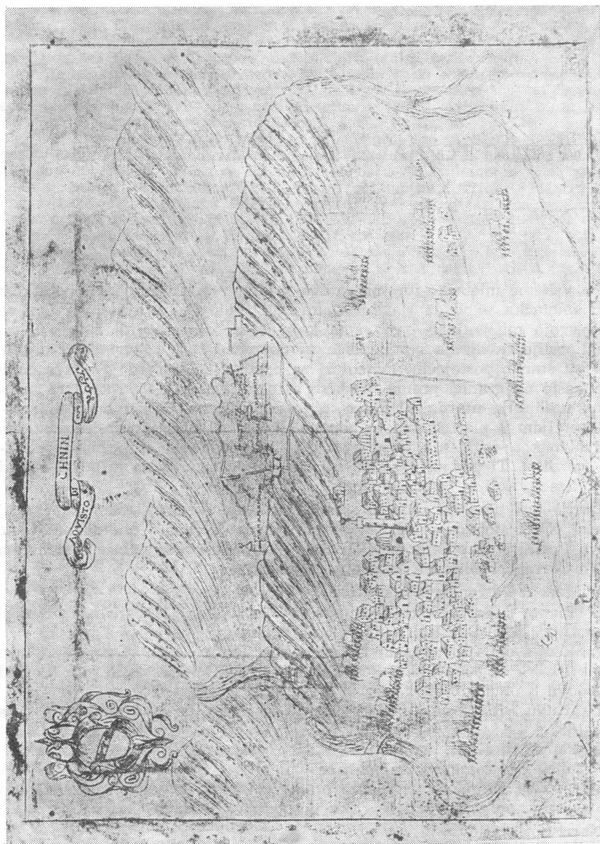
Nacrt br. 1, »Osvojenje Kinina«, nacrt iz XVII st. (Museo Correr, Venecija)