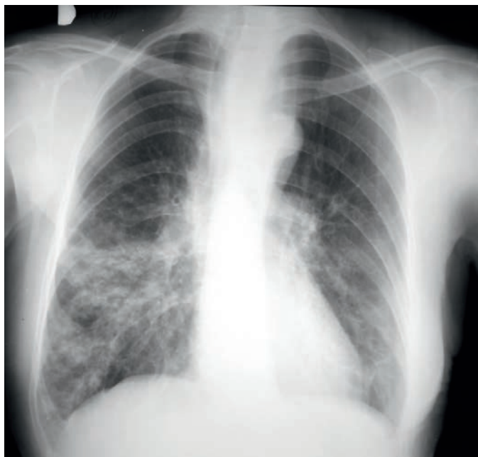
SLIKA 2. Bronhopneumonija – konfluentna mrljasta žarišta neoštro ograničena

Ovako se najčešće prezentiraju sekundarne pneumonije, pneumonije nastale hematogenom diseminacijom, ali i primarne pneumokokne pneumonije te katkad i atipične pneumonije. Najčešće je uzrokovana S. aureusom i H. influenzae (slika 2.).