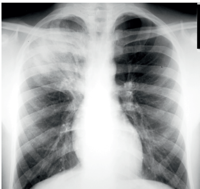
SLIKA 1. Lobarna pneumonija kao homogena lezija s prikazanim zračnim bronhogramom

Lobarna pneumonija radiološki se najčešće prikazuje kao homogena lezija koja polazi od periferije prema jezgri plućnog parenhima sa zračnim bronhogramom ili bez njega, uz moguće povećanje volumena zahvaćenog parenhima. Najčešći uzročnici jesu S. pneumoniae , Klebsiella pneumoniae , L. pneumophila , H. influenzae i katkad M. pneumoniae . Ovakav je nalaz, dakle, karakterističan (specifičan) za bakterijsku pneumoniju (slika 1.).