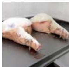
Slika 1. Suho soljenje