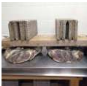
Slika 2. Prešanje