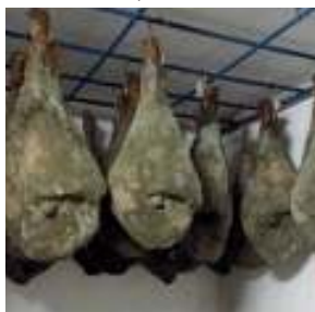
Slika 4. Zrenje

U ovom su opisane razlike u tehnologiji proizvodnje pršuta u RH. U tom smislu osnovni cilj ovoga rada je utvrditi kemijski sastav te njegovu možebitnu povezanost s tehnološkim procesom proizvodnje pršuta. Imajući na umu različitosti genetskog potencijala životinja, tehnologiju uzgoja i tova, te posebnosti samog tehnološkog procesa proizvodnje pršuta očekujemo razlike kemijskog i masnokiselinskog sastava kao parametara kakvoće istarskog, dalmatinskog i drniškog pršuta.