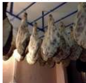
Slika 3. Sušenje