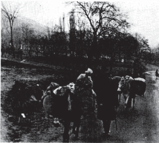
Sl. 1. — Kod strumičkog sela Banica, magarci u tovarnom saobraćaju.

Kao što se zna: promene u broju stoke zavise od prirodnih odlika oblasti, na primer od jakih suša, pa od stočnih bolesti, od iseljavanja stanovništva, od etničkog sastava stanovništva (muslimani ne gaje svinje), zatim mladi seoski svet većinom traži prihode van stočarstva i izvan svojih naselja. Grad Strumica privlači okolno seosko stanovništvo i to takođe utiče na stanje stočarstva u okolnim selima.