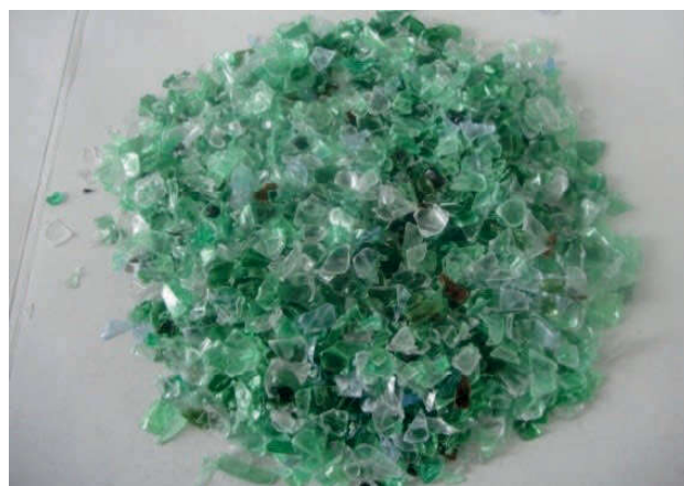
Slika 4. Prozirni i šareni listići PET-a