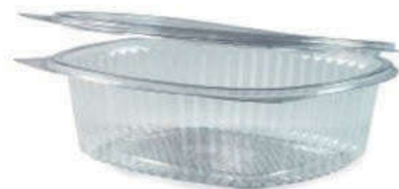
Slika 6. PET vakuumat

Proizvodnja PET vakuumata proces je kojim se iz ravne folije dobiva određeni oblik potreban za pakiranje proizvoda. Najčešće se radi o posudicama za pakiranje raznovrsnih prehrambenih proizvoda. PET vakuumati (Slika 6) proizvode se procesom vakuumiranja iz ravne folije pri čemu se dobiva željeni oblik posudica.