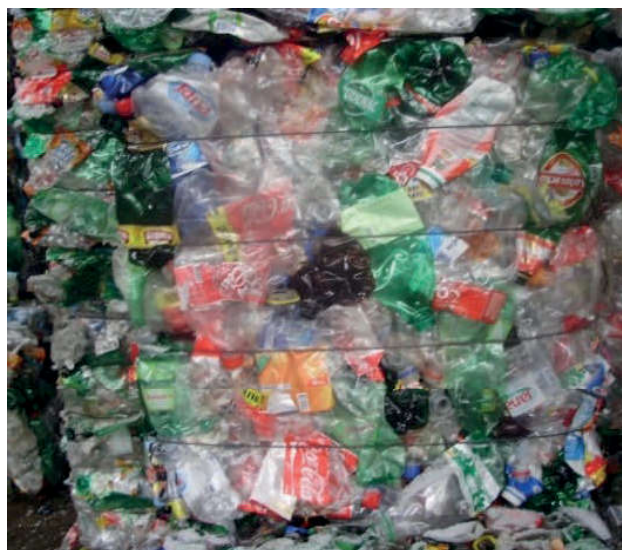
Slika 2. Balirana PET ambalaža

Odlaganje polimernog otpada znači ekonomsku, ali ne i znatnu ekološku štetu, jer je plastični otpad neutralan i pridonosi stabilnosti odlagališta. S obzirom na nerazgradljivost polimernog otpada, na odlagalištima nema emisija plinovitih i kapljevitih onečišćenja, koje su posljedica biorazgradnje materijala u odlagalištu. Budući da se polimerni materijali upotrebljavaju nekih 70-tak godina, još uvijek nema dovoljno informacija o njihovom djelovanju na odlagalištima, osim da pokazuju vrlo male promjene i nakon niza godina.