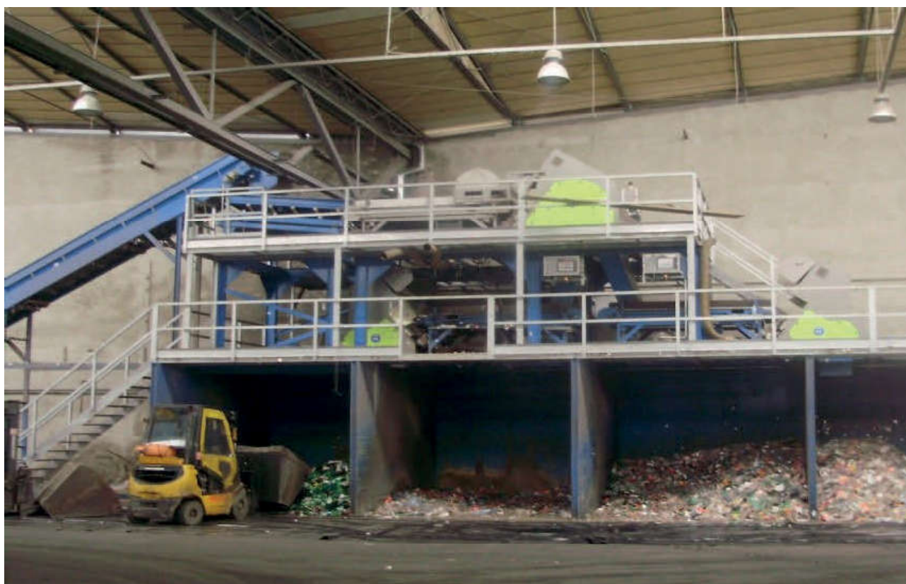
Slika 3. Linija za sortiranje otpadne PET ambalaže

Otpadna ambalaža sortirana po boji melje se na frakcije dimenzija 8-12 mm u mlinu koji se nalazi u vodi. Samljeveni PET zatim se transportira u centrifugu gdje se cijedi i suši, a mehanički se odvajaju komadići etiketa i nečistoće. Ova faza završava u vertikalnom selektoru koji odvaja etikete (poliolefini) od ostalog materijala, a očišćeni PET listići idu u daljnju obradu.