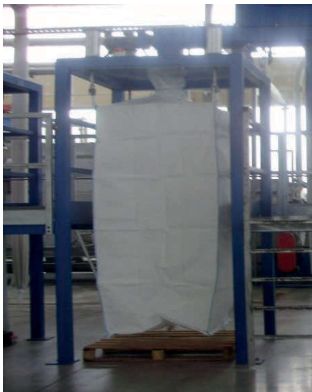
Slika 5. Pakiranje mljevenog PET-a