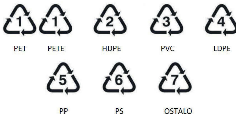
Slika 1. Simboli pojedinih vrsta polimernih materijala

Sortiranje polimernog otpada provodi se ručno ili automatiziranim vođenjem pomoću računala. Ručno sortiranje, koje je najčešće neefikasno i ekonomski nepovoljno, vrši se na osnovi vizualne identifikacije otisnutog identifikacijskog broja na ambalaži te na osnovi nijansi i različitih obojenja. Automatizirano sortiranje bazira se na metodi identifikacije otpadnih plastičnih materijala odnosno prema razlikama u kemijskim, optičkim, električnim ili fizikalnim svojstvima plastičnih materijala. Većina fizikalnih procesa oslanja se na jedinstveno svojstvo nekog polimera kao što su: gustoća, hidrofobnost, prisustvo klora ili na specifično svojstvo polimera koje varira sa temperaturom; točka taljenja, topljivost. Komercijalna metoda sortiranja mora biti brza, pouzdana, ekonomična i fleksibilna kako bi dorasla različitim oblicima kontaminacije kao npr. variranju boje. Nakon provedenog procesa sortiranja, plastika se priprema za recikliranje. Kako bi otpadna plastika bila prikladnija za transport i punjenje reciklažnog postrojenja, neophodno je usitnjavanje plastike zbog njene voluminoznosti. Mehaničke tehnike usitnjavanja su: mrvljenje i granuliranje; zgušćivanje i zbijanje te mljevenje u prah. Postupak usitnjavanja otpadne plastike omogućuje odstranjivanje ostalih materijala s proizvoda, a često se postupci usitnjavanja kombiniraju s procesom recikliranja.