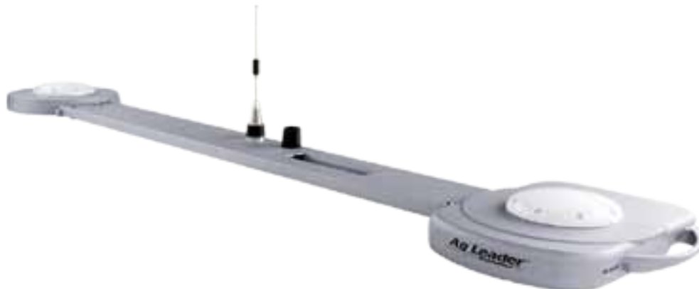
Slika 4. GPS prijemnik na krovu traktora.