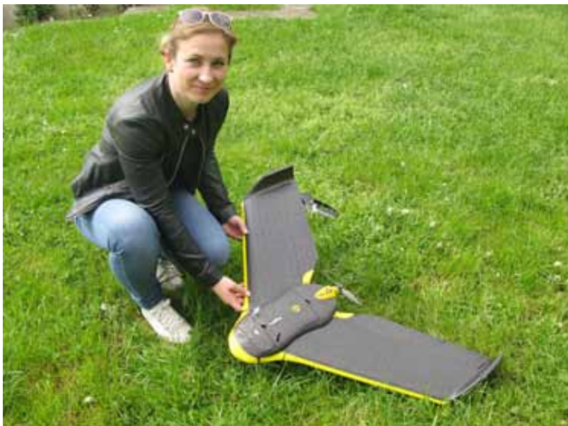
Slika 6. Bepilotni sustav senseFly eBee Ag.

Masa letjelice iznosi 710 grama, pogoni se litij-polimer baterijom zbog čega nema štetnih utjecaja na okoliš, a autonomija leta doseže 45 minuta. Nominalna brzina letenja kreće se od 40-90 km/h, visina 50-300 m iznad tla, a u jednom letu može snimiti područja i do 1000 ha.