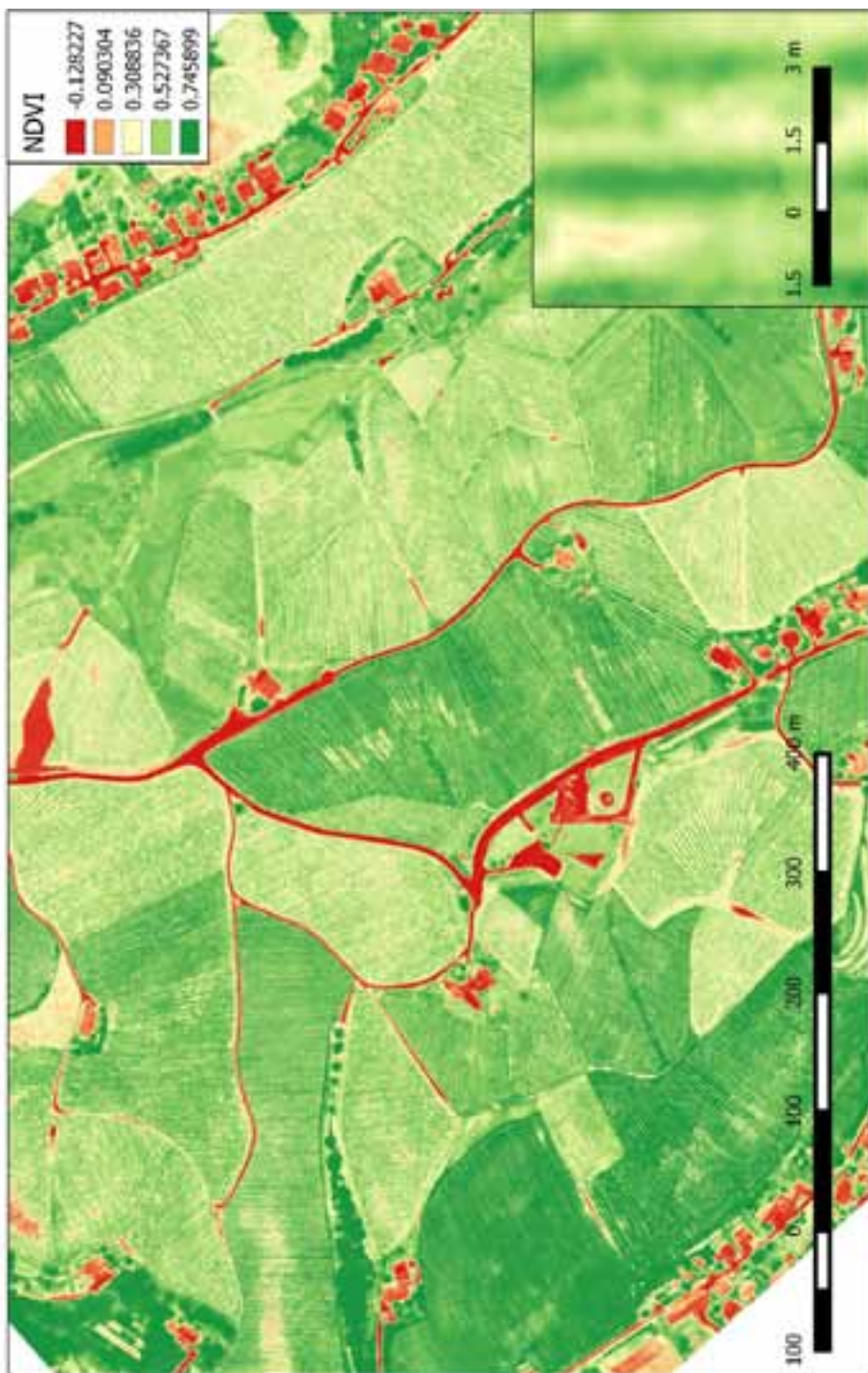
Slika 10. NDVI i RGB prikaz vinograda „Zlati Grič“ 10. lipnja 2015. godine.