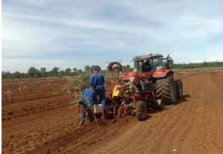
Slika 2. Sadnja maslina i postavljanje cijevi za navodnjavanje.

Prema istraživanju Sito i sur. (2013) utvrđeno je da su primjenom GNSS sustava, točnije DGPS-a (diferencijalni globalni pozicijski sustav), kod sadnje maslina odstupanja od zadanih dimenzija između redova bila svega 1-3 cm, za razliku primjene lasera gdje su ta odstupanja bila veća, a radni učinak značajno manji. Prednost GNSS-a kod sadnje maslina je precizna sadnja, posebno na nepravilnim i neravnim površinama (slika 2).