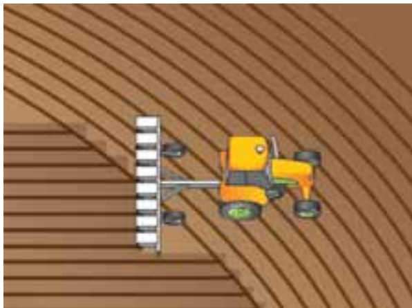
Slika 1. Shematski prikaz sjetve uporabom GNSS-a.

GNSS prijarnik (antena) prikuplja kontinuirano odašiljane signale sa satelita temeljem kojih se određuje položaja na Zemlji (statusu GNSS-a vidi u Bilajbegović 2010). Korištenjem CROPOS (Hrvatski pozicijski sustav) usluge VPPS-a (umreženo rješenje faznih mjerenja u realnom vremenu) ostvaruje se točnost pozicioniranja od 2 do 4 cm (vidi Marjanović 2010), što u poljoprivredi odgovara preciznom definiranju položaja stroja. U RH se GNSS sustav koristi uglavnom na većim proizvodnim površinama prilikom sjetve ili sadnje, gnojidbe i zaštite usjeva ili nasada (slika 1).