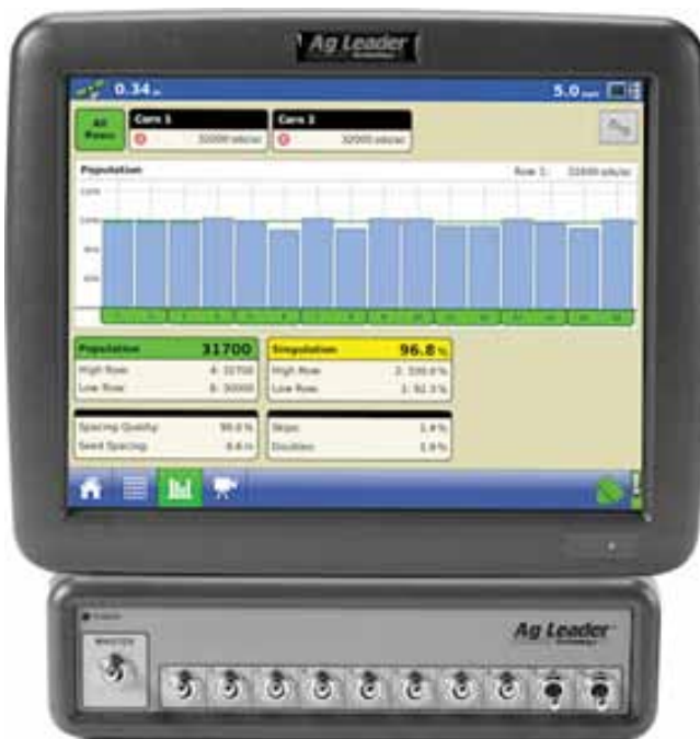
Slika 5. Kontrolni monitor s mogućnošću nadziranja rada i upravljanja priključcima.