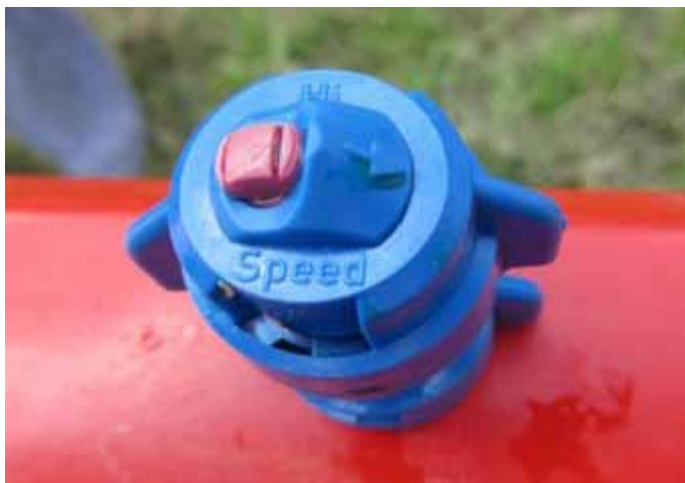
Slika 2. Mlaznica TurboDrop HiSpeed 110-03

Ta mlaznica spada među najnovija dizajnerska rješenja u proizvodnji mlaznica za smanjenje zanošenja sa simetrično orijentiranim mlazovima, tako da je pogodna za korištenje kod visokih brzina. To povećava produktivnost i kvalitetu depozita na biljkama pa se naširoko koristi na velikim površinama. Idealna je za prskanje fungicidima i insekticidima kod radnog tlaka od 4 do 8 bara. Također se odlikuje poboljšanim pokrivanjem vertikalnih i skrivenih dijelova biljaka (Produkt katalog 109 Agrotop 2013).