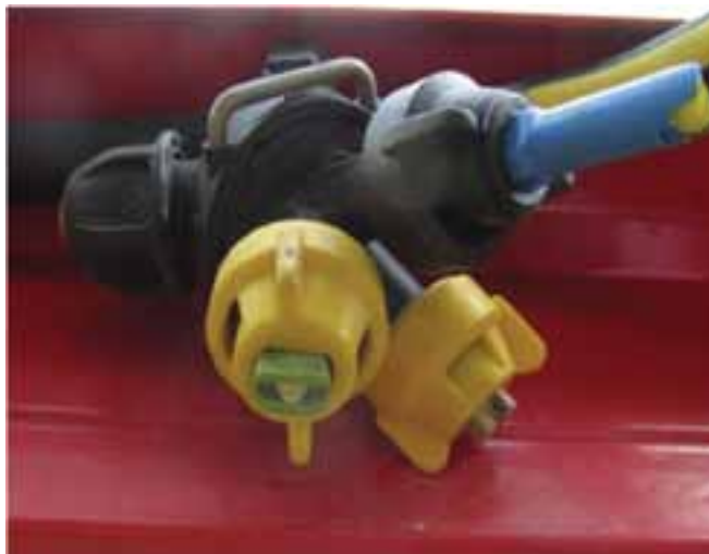
Slika 4. Lechler LU 120-03

Mlaznica Lechler LU je univerzalna poboljšana standardna mlaznica s izlaznim kutom 120^\circ kod protoka od 0,3 galone/minuti koja se koristi za nanošenje svih sredstva za zaštitu bilja i regulatora rasta. Taj tip mlaznica koristi se u području radnog tlaka od 1,5 do 5 bara. Mlaznica tipa Lechler LU može proizvesti razne veličine kapljica - od vrlo finih do ekstremno velikih. Veličina kapljica varira ovisno o radnom tlaku. U praksi su postignuti vrlo dobri rezultati prskanja također kod brzine vožnje od 10 km/h, potrošnje vode od 130 l/ha te radnog tlaka od 2,5 bara (Lechler Katalog 2010).