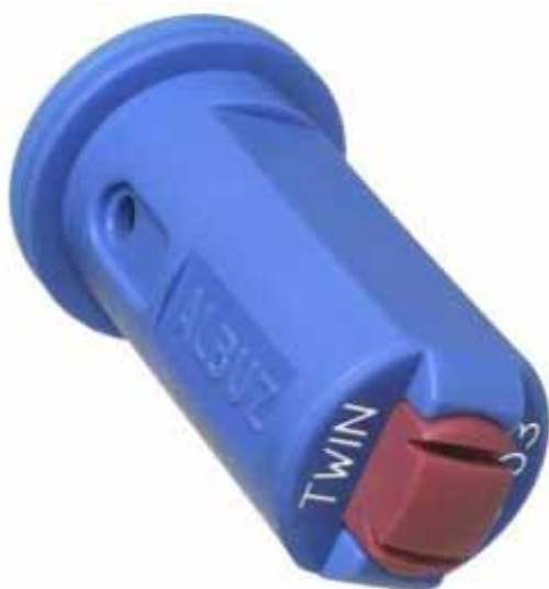
Slika 1. Mlaznica AVI TWIN 110-03

Spada u skupinu anti-drift mlaznica namijenjenih za upotrebu u širokom rasponu radnog tlaka (3 do 7 bara). Sastoji se od dvaju keramičkih otvora koji omogućuju visoku preciznost i otpornost na trošenje. Između dvaju mlazova nalazi se kut 60°, a izlazni kut pojedinog mlaza iznosi 110°. Prvi mlaz usmjeren je pod kutom od 30° unaprijed u smjeru vožnje, a drugi pod kutom od 30° nasuprot smjeru vožnje. Mlaznica osigurava ravnomjernu raspodjelu kapljica na terenu, a nagib mlaznice poboljšava dubinu penetracije kapljica u biljku. Uz pomoć Venturi učinka za stvaranje mjehurića zraka u kojem se nalazi sredstvo za prskanje, kapljice su velike i ispunjene zrakom. Na taj način smanjuje se drift i poboljšava se naslaga na biljke. Minimalna visina armature iznad biljki iznosi 50-60 cm (Catalogue Albuz, 2009).