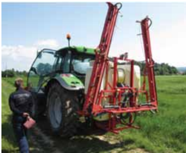
Slika 5. Prskalice Agromehanika AGS 1000 EN.

Na pokusnom polju UKC Agronomskog fakulteta u Pivolu proveden je praktični eksperiment u usjevu ozimog ječma sorte "Akropolis" (Agrosaati) u razvojnoj fazi cvatnje. Testirane mlaznice instalirane su na krila prskalice Agromehanika Kranj, model AGS 1000 EN koji je vučen traktorom Deutz Fahr K90 snage 67 kW kod 1300 \text{ min}^{-1} okretaja motora te 540 \text{ min}^{-1} okretaja priključnog vratila. Za određivanje depozita koristio se fluorescentni marker (citrononino žuti, 25% tartrazina, proizvođača Etol d.d.) u koncentraciji od 1 g tartrazina/1 litru vode.