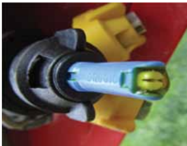
Slika 3. Mlaznica Lechler ID 120-03.

Mlaznica Lechler ID jedna je od prvih anti-drift mlaznica koje su se pojavile na tržištu, a također je najviše rasprostranjena u Europi. Mlaznice tog tipa u praksi su se pokazale dosljedne i pouzdane. Koriste se za nanošenje svih sredstva za zaštitu bilja i regulatora rasta, a također su postignuti vrlo dobri rezultati kod prskanja tekućih gnojiva. Mlaznica ID 120-03 stvara velike do ekstremno velike kapljice u obliku mjehurića. Ugao prskanja mlaznice iznosi 120°, kod protoka 0,3 galona/minuti (1,1 litre/minuti). U ID mlaznicu Lechler ugrađen je plastični uložak koji se može lako rastaviti i očistiti. Na tijelu mlaznice nalaze se dva otvora za usisavanje zraka, koja smanjuju mogućnost začepjenja. Ta mlaznica omogućuje prskanje kod brzina vjetra do 5 m/s te brzine vožnje od 10 km/h (Lechler Katalog 2010).