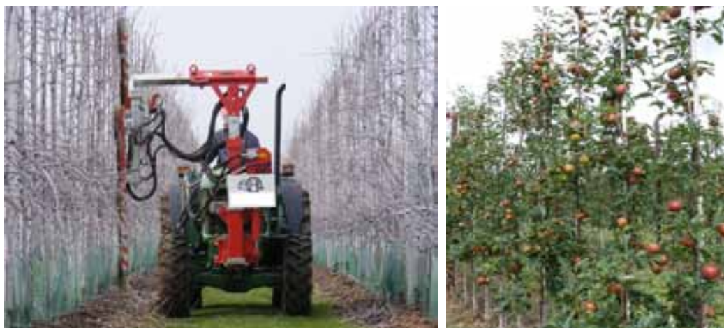
Slika 1. Uzgojni oblik zida u zimskoj rezidbi (lijevo) te prije berbe (desno)

Pri stvaranju novih nasada važno je razmišljati o sadnom materijalu kojim bi postigli najbolji uspjeh strojne rezidbe. Jedna je mogućnost stablo sa dvije provodnice ('Bibaum') i manje jakim skeletnim granama te uskim stablom (Slika 2).