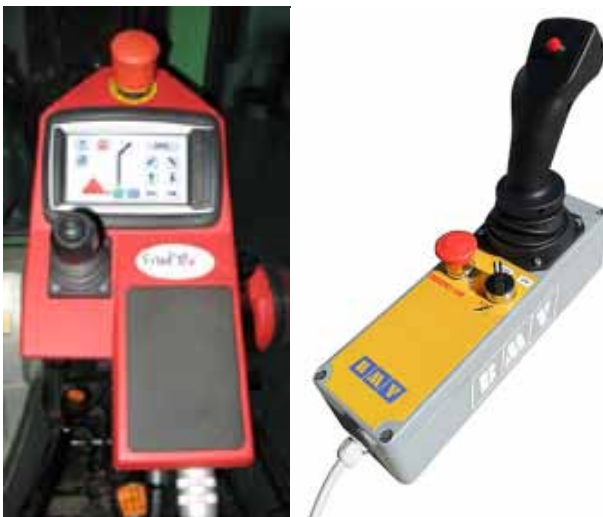
Slika 6. Različite vrste ručica za upravljanje - joysticka

Stroj za rezanje priključen je na prednju traktorsku hidrauliku, a vođen je višenamjenskom hidrauličnom upravljačkom jedinicom 'joystickom' za pogon noža (Slika 6), bočno podešavanje stroja, nagibanje rezidbene jedinica te kontrolu visine stroja.