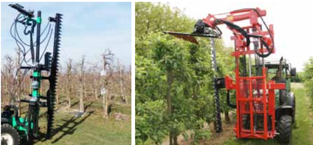
Slika 3. Fama (lijevo) i Fischer (desno) stroj za rezanje duplom kosom

Prema načinu rezanja strojevi se mogu podijeliti na one s duplom kosom (Slika 3), s rotirajućim noževima (Slika 4) ili cirkularima (Slika 5). Sustavi s noževima razvijeni su izravno iz vinogradarske tehnike zbog čega je debljina orezanih grana ograničena na cca. 1,5 cm, dok je kod sustava s cirkularom odlična rezidba i kod debljih grana (Slika 4, desno).