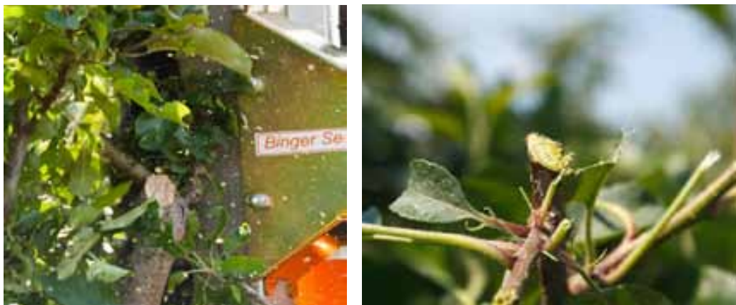
Slika 8. Strojno orezana grana u fazi 10-12 listova pomoću Binger stroja

Pojedini voćari dobili su vrlo dobre rezultate kod debelo plodnih sorti Jonagold, Fuji i Boskoop, ali slabije kod sitno plodnih Elstar i Golden Delicious. Strojna rezidba debelih sorti trebala bi započeti u fazi crvenog pupoljka (BBCH 56-57). Ako je u pitanju alternativna plodnost, te je sorte bolje rezati kasnije kada je na jednogodišnjim izdancima razvijeno 10 do 12 listova (Slika 8). U mnogim eksperimentima pokazalo se da je idealno vrijeme za provedbu strojne rezidbe sitno plodnih sorti (Gala, Golden Delicious i Pinova) uz upotrebu navodnjavanja odmah nakon ubiranja, dok se na siromašnim plantažama bez navodnjavanja ponovno najbolja pokazala strojna rezidba u fazi crvenih pupoljaka.