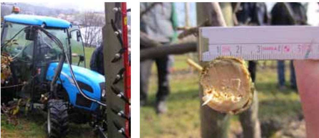
Slika 4. BMW stroj s rotirajućim noževima (lijevo) te izgled orezane grane (desno)