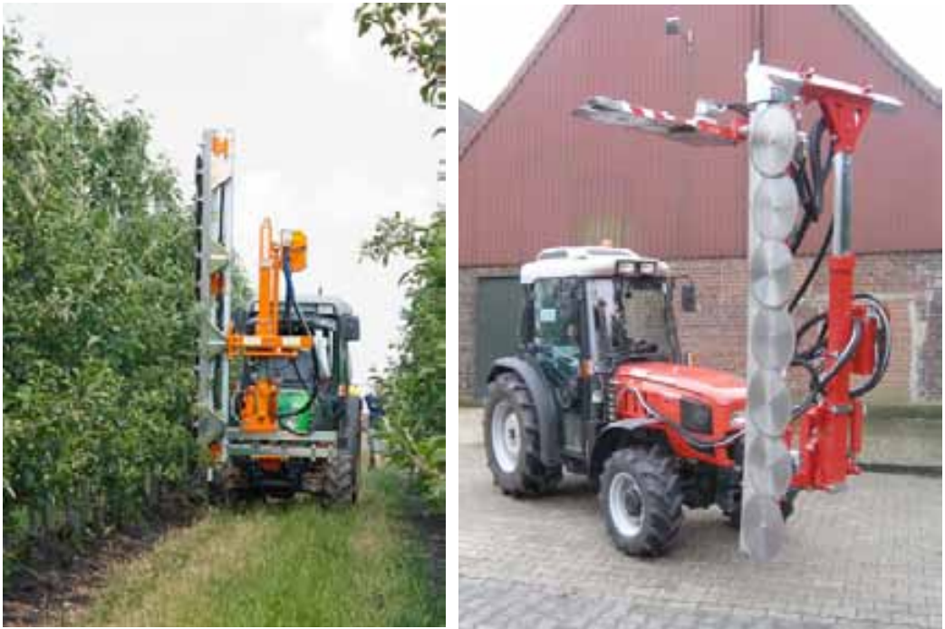
Slika 5. Binger (lijevo) i ERO (desno) stroj za rezanjem 'cirkularom'

Stroj za rezanje priključen je na prednju traktorsku hidrauliku, a vođen je višenamjenskom hidrauličnom upravljačkom jedinicom 'joystickom' za pogon noža (Slika 6), bočno podešavanje stroja, nagibanje rezidbene jedinica te kontrolu visine stroja.