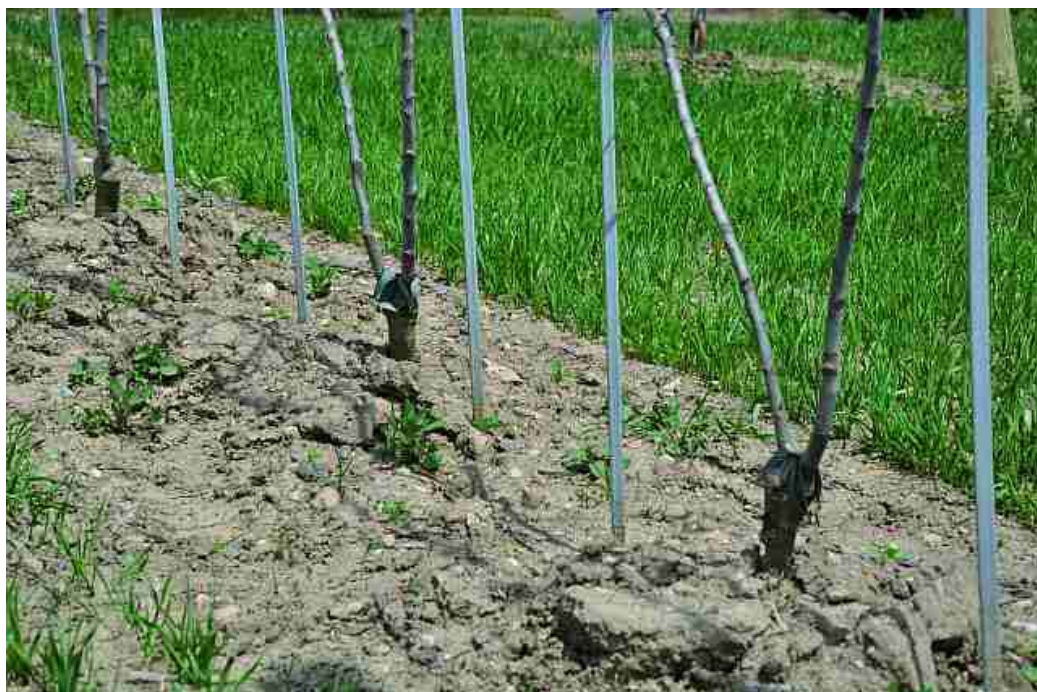
Slika 2. Sadnica s dva stabla (Bibaum) nudi putem svojih kratkih izdanaka optimalne uvjete za strojnu rezidbu

Pri stvaranju novih nasada važno je razmišljati o sadnom materijalu kojim bi postigli najbolji uspjeh strojne rezidbe. Jedna je mogućnost stablo sa dvije provodnice ('Bibaum') i manje jakim skeletnim granama te uskim stablom (Slika 2).