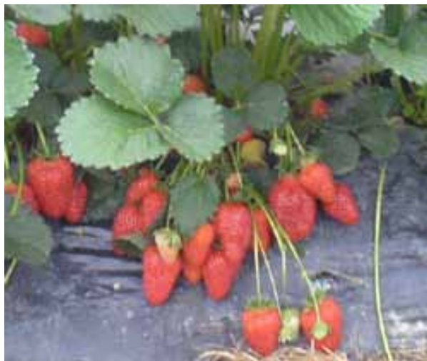
Slika 1. Sorta Diamante, uzgoj na crnoj foliji

Registrirana je 1991.godine na UC Davisu u Kaliforniji. Dobrih karakteristika, pokazala se boljom od dotadašnjih najzastupljenijih sorata neutralnog dana, Selve i Seascapea, posebno zbog višeg prinosa, uspravnijeg rasta, krupnijeg i tvrdog ploda i bolje otpornosti na bolesti i štetnike pr.na pepelnicu. U odnosu na sorte Selvu i Seascape kasnije počinje s plodonošenjem. Izvrsnog je okusa, kvalitete, zbog svjetlije boje unutrašnjosti više se preporuča za svjež upotrebu, a manje za preradu ( http://research.ucdavis.edu/strawberry ).