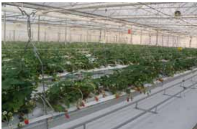
Slika 4. Intenzivni uzgoj jagoda neutralnog dana izvan sezone

Za optimalne uvjete uzgoja i u konačnici viši prinos može se istovremeno koristiti i niske tunele unutar visokih (Rowley i sur., 2011). Jagode se sade u jesen ili proljeće. Kod uzgoja neutralnih sorata osim izbora sorte za konačan uspjeh i kvalitetu ploda važan je i datum sadnje te vrsta sadnog materijala (Ruan i sur., 2013b).