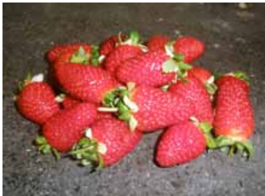
Slika 3. Plodovi sorte Monterey

Registrirana je 2009. godine, nastala je kao rezultat križanja između sorte Albion i selekcije Cal 97.85-6 provedenog 2001. godine. Izvrsnog je okusa, dobrog omjera šećera i kiseline ( http://research.ucdavis.edu/strawberry ). Slična je sorti Diamante, ali višeg prinosa, kvalitetnijeg ploda, boljeg okusa i otpornosti. Nedostatak joj je osjetljivost na pepelnicu. Krupnijeg je ploda od sorte Albion, slična po produktivnosti, za uzgoj treba više prostora (Shaw i Larson, 2009a).