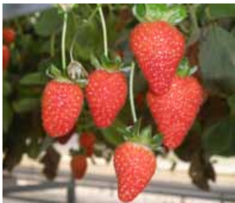
Slika 2. Plodovi sorte Capri

Sorta razvijena u Italiji. Srednje je bujnosti, dobre otpornosti na gljivične bolesti. Postiže visoki prinos, plodovi su krupniji, ujednačeni, atraktivnog izgleda, aromatični, visokog sadržaja šećera, izvrsnog okusa, crvene boje mesa. Plodovi su čvršće konzistencije što je važno kod manipulacije i transporta ( www.civ.it/it/prodotti ), te svjetlije boje od sorte Albion.