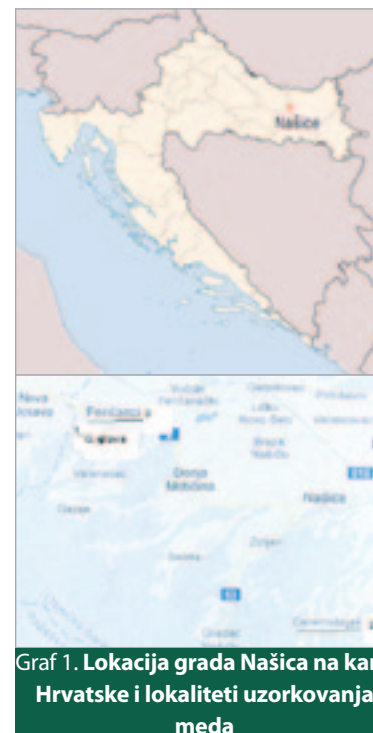
Graf 1. Lokacija grada Našica na karti Hrvatske i lokaliteti uzorkovanja meda

Prema Pravilniku o kakvoći uniflornog meda (NN 122/09, 2009.) Republike Hrvatske vrsta meda je monoflorna, ukoliko med u netopivom sedimentu sadrži najmanje 45% peludnih zrnaca iste biljne vrste. Iznimno ovome, med se razvrstava u skupinu monoflornih medova, ako udio peludnih zrnaca u netopivom sedimentu iznosi najmanje 45% peludi iste biljne vrste, međutim za pojedine vrste meda postoje odstupanja (pitomi kesten ( Castanea sativa Mill.) 85%, lucerka ( Maedicago sativa L.) 30%, ružmarin ( Rosmarium officinale L.) 30%, lipa ( Tilia sp.) 25%, kadulja ( Salvia sp.) 20%, bagrem ( Robinia pseudoacacia L.) 20%, lavanda ( Lavandula sp.) 20%). Poliflorni med je mješavina monoflornih vrsta meda različitih biljaka (Pravilnik o kakvoći uniflornog meda RH, NN 122/09, 2009; Pravilnik o medu RH, NN 93/09. 2009.). Zadatak ovih istraživanja bio je determinirati peludni sastav u 3 uzorka meda s područja Našica i na temelju morfologije peludnih zrnaca odrediti botaničko podrijetlo te deklarirati ih kao monoflorne ili poliflorne medove.