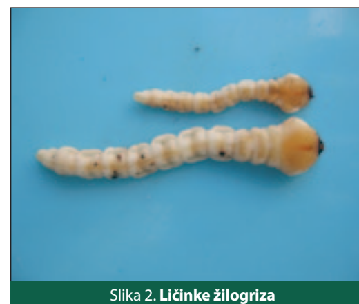
Slika 2. Ličinke žilogriza

žilogriz, izgubili su registraciju i više se ne mogu pronaći na našem tržištu, a umjesto njih nije osigurana odgovarajuća alternativa. Ako tomu pridodamo činjenicu pojave sve toplijih i sušnijih ljetnih razdoblja (posljednje desetljeće je najtoplije od kada postoje mjerenja) koja su pridonijela širenju ovog štetnika iz mediteranskih prema kontinentalnim područjima, uočljivo je da će žilogriz postajati sve češći i sve značajniji ograničavajući čimbenik uzgoja koštičavih voćnih vrsta. Zbog toga od ove godine poteškoća sa žilogrizom nemaju samo voćari s područja Hercegovine i Dalmacije, već i vlasnici voćnih nasada s juga Srbije kojima do sada spomenuti štetnik nije činio ekonomski značajne štete.