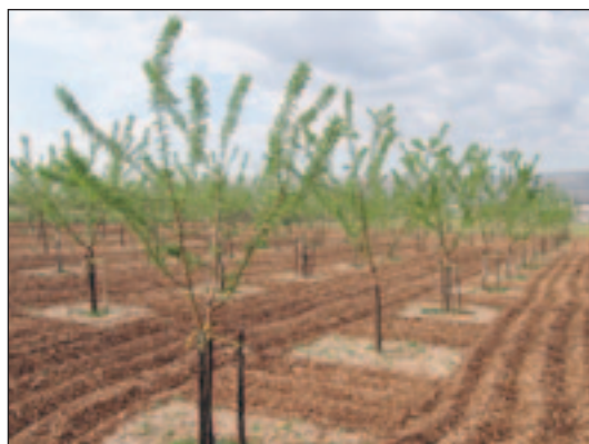
Slika 5. Voćke cijepljenje na podlozi gorkog bajama

koja su se kasnije razvila i kasnije napustila svoje kukuljice zbog snižavanja srednjih dnevnih temperatura zajedno sa ženkama koja su odložile jaja odlaze na prezimljavanje. Prezime na tlu ispod kamena, grude tla ili listinca. Tijekom zime imaga veoma dobro podnose niske zimske temperature i u tom razdoblju uopće se ne hrane. Sljedeće godine tijekom proljeća kad se podignu srednje dnevne temperature, napuštaju zimska skloništa i ciklus razvoja se nastavlja.