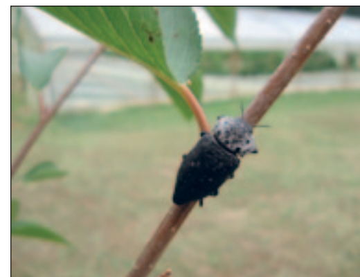
Slika 1. Imago žilogriza

Povećana brojnost tog štetnika izravna je posljedica neželjenih ratnih događanja zbog kojih je na jugu Hercegovine dugi niz godina egzistirao veliki broj napuštenih, zapostavljenih nasada bresaka, trešanja i marelica unutar kojih su se redovito nalazila obamrla i osušena stabla. Spomenuti voćni nasadi postali su svojevrsna žarišta zaraze, ali i lokaliteti na kojima je zbog brojnosti tog štetnika danas vrlo teško uzgajati koštičave voćne vrste. Osim toga, veliki broj aktivnih tvari i insekticida koji su nekad dobro djelovali, tj. suzbijali