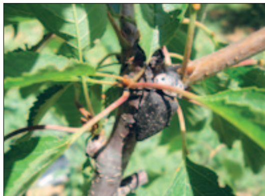
Slika 3. Imago prilikom ishrane s peteljkom listova