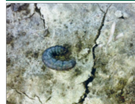
Slika 8. Gusjenice sovica ipsilon