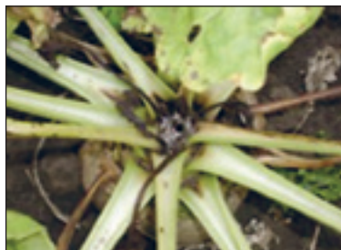
Slika 5. Štete od gusjenica repinog moljca

Na biljkama šećerne repe nalazi se tijekom cijele vegetacije, a najveću brojnost pokazuje od polovice ljeta. Ženke polažu jaja na najmlađe lišće u sredinu glave šećerne repe. Gusjenice koje se potom razvijaju hrane se tim najmlađim listovima prekrivajući sredinu glave paučinastim nitima i izmetom. Nakon kratkog vremena taj dio postaje crn i trune.