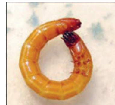
Slika 3. Žičnjak

Gusjenice repinog moljca koje prave štetu kad odrastu dostižu dužinu 10-12 mm.