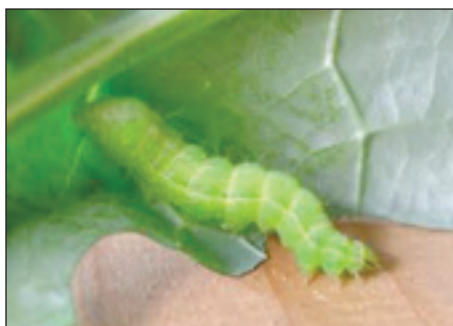
Slika 9. Gusjenica sovice gama

Sovice gama se razlikuje od prethodne dvije jer je migrant kojem se za vrijeme migracije od Afrike prema sjeveru razvije 5-7 generacija. Druga razlika je manji broj nogu gusjenica pa se kreću savijanjem. Embrionalni razvoj traje 3-7 dana, a gusjenice prolaze kroz pet razvojnih stadija u trajanju oko tri tjedna. Kod nas ima 3-4 generacije. Brojnost ovog štetnika ovisi o hrani, klimatskim čimbenicima (vlažno i toplo u svibnju i lipnju), oboljenju od parazita i drugih pri-