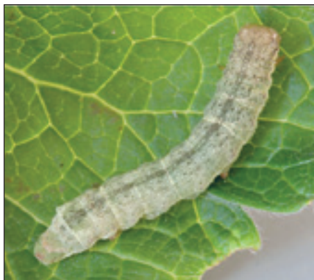
Slika 9. Gusjenica kupusne sovice

Sovice te grupe hrane se lišćem šećerne repe. Budući da je za razvoj jaja i gusjenica prvog stadija potrebna vrlo visoka relativna vlažnost zraka (95-100%), što ujedno znači i povoljne uvjete za rast šećerne repe, karakterizira ih proporcionalna brojnost s visinom prinosa. Tri su najznačajnije: kupusna ( Mamestra/Barathra/brassicae L.), povrtna ( Lacanobia/Mamestra, Barathra/oleracea ) i sovice gama ( Autographa/Plusia, Phytometra/gama L.).