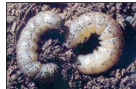
Slika 7. Gusjenice usjevne sovice

Proljetna sovica prezimljuje u ljuski jaja odakle rano u proljeće izlazi i kao štetnik najranija je vrsta pozemljuša – već u travnju. Ima samo jednu generaciju godišnje, a za razliku od ostalih sovic jaja su vrlo otporna na niske temperature prezimljavanja (-17°C). Štete zbog načina širenja pravi oazno.