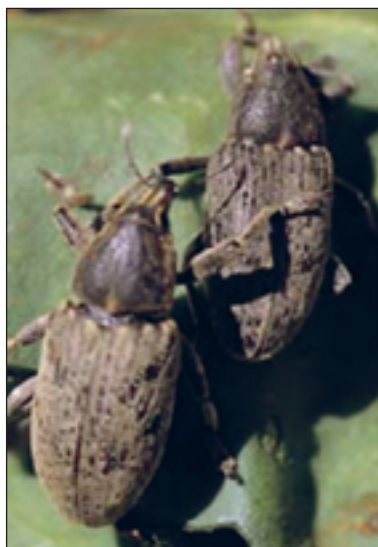
Slika 2. Repina pipa

Osim repine, šećernu repu napada i kukuruzna i lucerkina pipa.