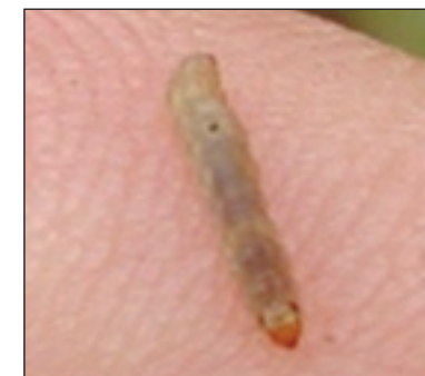
Slika 4. Gusjenica repinog moljca