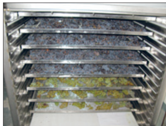
Slika 1. Prosušeno grožđe u sušari

Temeljem provedenih istraživanja prosušivanja grožđa sorte Muškati žuti (slika 2.) i Muškati ruža crni (slika 3.), odnosno kemijske analize, u prosjeku je dobiveno vino od 16,5 vol% i ostatak od neprovrela šećera od 102,5 g/L, što znači da je sok iz bobica nakon prosušivanja sadržavao 378 g/L ili 173°Oe. Prosušeni uzorci grožđa prethodno su sprešani u maloj preši do tlaka maksimalno od 1.5 bar. Tijekom fermentacije upotrijebljen je kvasac SV19 VASON soj S.C.Bayanus, a fermentacija je trajala 30 dana na temperaturi od 18°C.