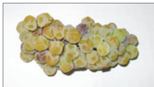
Slika 2. Prosušeni grozd sorte Muškati žuti