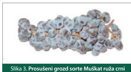
Slika 3. Prosušeni grozd sorte Muškati ruža crni

Na slici 1. prikazan je prototip pokusne laboratorijske sušare za prosušivanje bobica grožđa. Tijekom procesa sušenja za grijanje zraka i pogon ventilatora korištena je električna energija. Ukupna masa grožđa prije sušenja sorte Muškati žuti bila je 32 kg, dok je na kraju sušenja iznosila 18,6 kg. Kod sorte Muškati ruža crni ukupna masa grožđa prije sušenja iznosila je 53 kg, a nakon sušenja 30,7 kg.