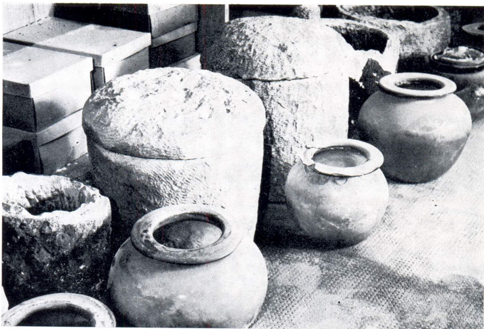
Staklene i kamene urne iz rimskog groblja u Lori

danim okolo u obliku kvadrata. Njihova se debljina kreće oko 6—7 cm, a dužina kao i visina im je 60—70 cm. Prostor između posude i ploča bio je ispunjen finom zemljom. Odozgo je sve bilo poklopljeno teškom pločom od jednog ili dva dijela čija je debljina iznosila i do 20 cm. U drugoj varijanti ostaci su pohranjeni u dosta grubim klesanim cilindričnim posudama od kamena s poklopcem u vidu kalote. Ovaj oblik urne vrlo je rasprostranjen u našim krajevima pa se sreće i u susjednoj Saloni. Drugi tip groba čine obične rake pokrivene velikim crepovima od kojih neki nose utisnut pečat PANSIANA. Proizvodi ove poznate antičke tvornice opekarskih proizvoda nalaze se na čitavom jadranskom području, a posebno u Dalmaciji.