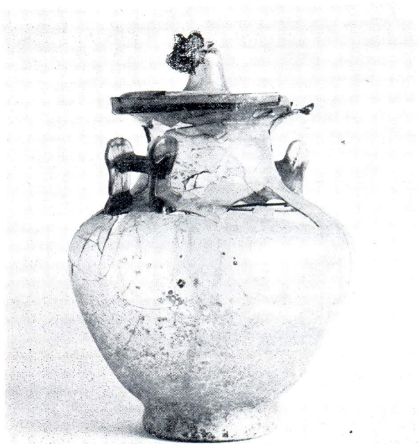
Najljepša staklena urna pronađena u antičkoj nekropoli u Lori

zakapala u zemlju ili stavljala u zidanu grobnicu te nadgrobni spomenik, najčešće u obliku stele.