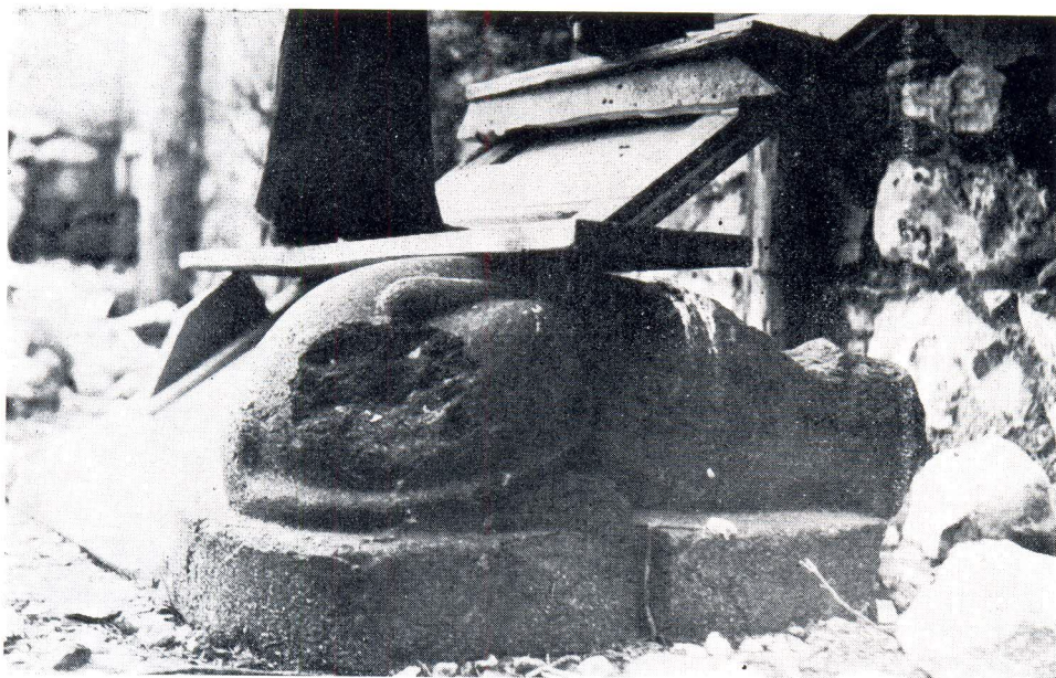
Egipatska sfinga kao potporanj skeli

Poznato je da se na Poljani kralja Tomislava u niši pored sjevernog periptera Dioklecijanova mauzoleja godinama nalazila jedna od egipatskih sfingi. Te granitne figure iz faraonskih vremena bile su dopremljene da svojom simbolikom uljepšavaju carske prostore. Ako se uzme u obzir, kao punovažan podatak, iz putopisa M. Bega »Primorski kraj« da se od sto dvadeset i osam egipatskih sfingi koliko ih je u svijetu nalazi u Splitu sedam, onda to predstavlja i te kako imponozantan broj na kome bi i mnoge metropole zavidjele. Sigurno je da bi svakom muzeju sfinga, pa makar i oštećena, dobro došla i da bi bila smještena na najreprezentativnijem mjestu. Međutim u Splitu ona je na zemlji, bačena kao najnevrijednija stvar. Nedavno je čitav mjesec poslužila kao potporanj skeli radnicima koji su na tom mjestu podizali ogradni zid, da bi nakon toga i dalje ostala na zemlji, među divljim raslinjem i smećem.