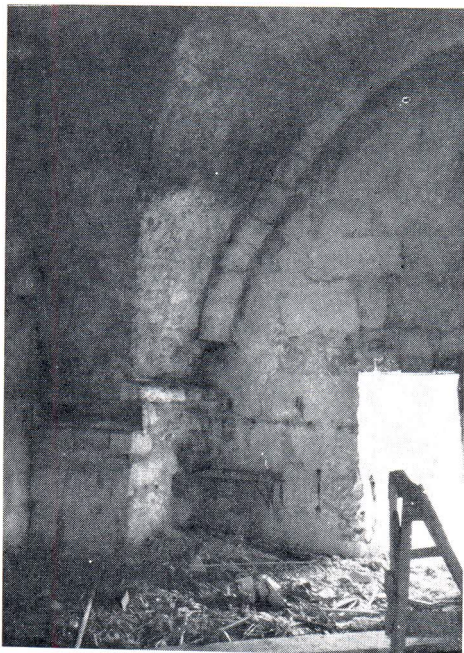
Gornji kat jugoistočne kule prije uredjenja 1968.

prilikom novi pod od crvenih mramornih ploča, da bi se bojom najviše približio prvobitnom crvenkastom podu prizemnih dvorana. Čvrstoćom materijala omogućila se suvremena upotreba, a kontrastom boje u odnosu na zidove jasno istakao autentični antički kamen sa svojom starom patinom. Ispod poda provedena je sva potrebna instalacija za koju su ostavljeni priključci koji omogućuju različitu suvremenu upotrebu. Osim poda svi su ostali dijelovi izvorni ili obnovljeni prema izvornim ostacima: četiri zida su u cijelost antička isto kao i prozori, koji su zatvoreni poliesterskim pločama, koje omogućuju prodor difuznog svjetla, da bi se mogao praktično praktično iskoristiti prizemni prostor. Strop od drvenih greda koje ulaze u izvorne udubine, odnosno naslanjaju se na izvorne konzole, obnovljen je prema prvobitnoj antičkoj konstrukciji.