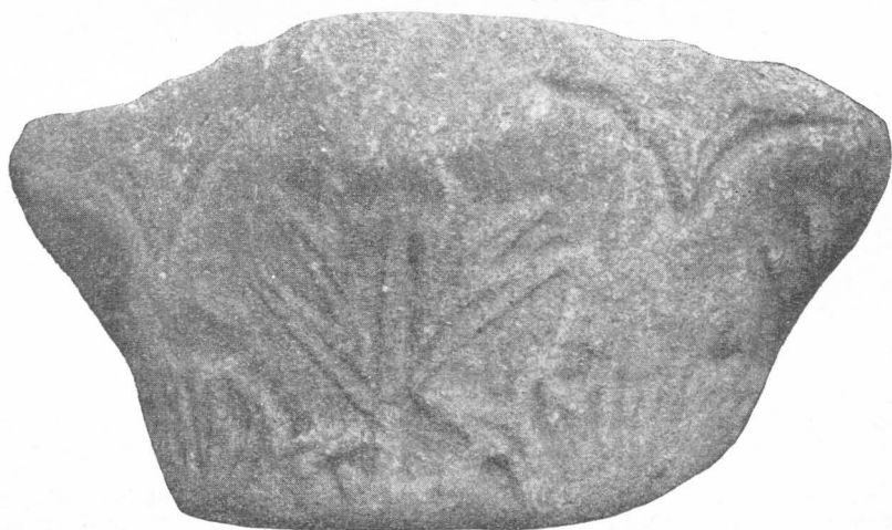
Povelja, Starokrščanska glavica