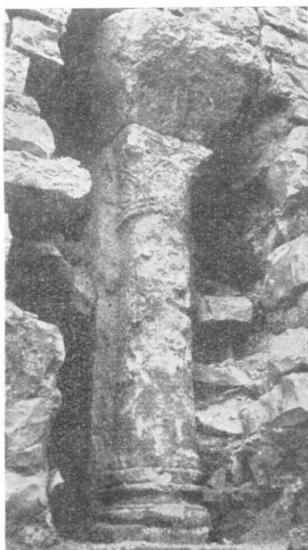
Stup trodijelnog prozora povaljske bazilike