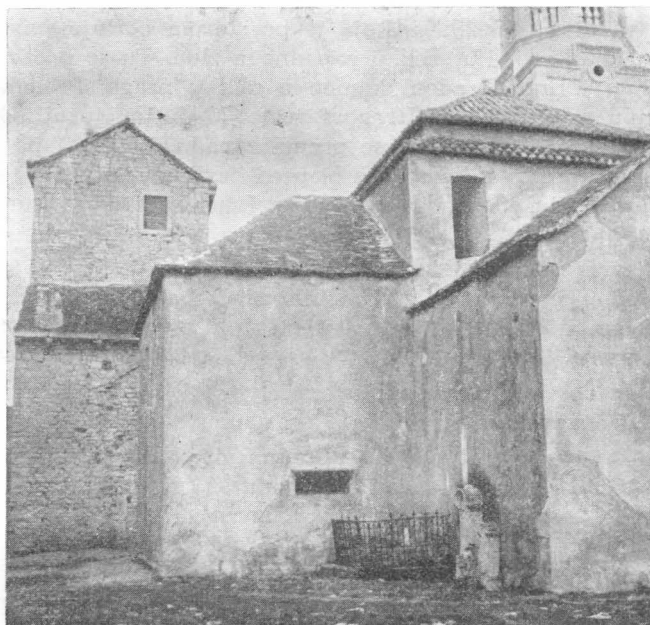
Povlja, Pogled na starokršćansku baziliku i krstionicu

U istom nasipu između svoda i zazidanog trodijelnog prozora apside nađen je izrađeni kamen (lice 20x15 cm, a debljina 11 cm), na kojemu su, poslije zadnjeg dijela slova R, urezana slova ERI. Iz sama tri čitava slovna znaka, ne da se utvrditi jesu li oni dio votivnog teksta posvećena nekom poganskom božanstvu (CERERI?) ili su dio natpisa iz starokršćanske bazilike. Oblik, naime, ovoga kamena dade se povezati sa dva ulomka profilirane ploče i sa dva