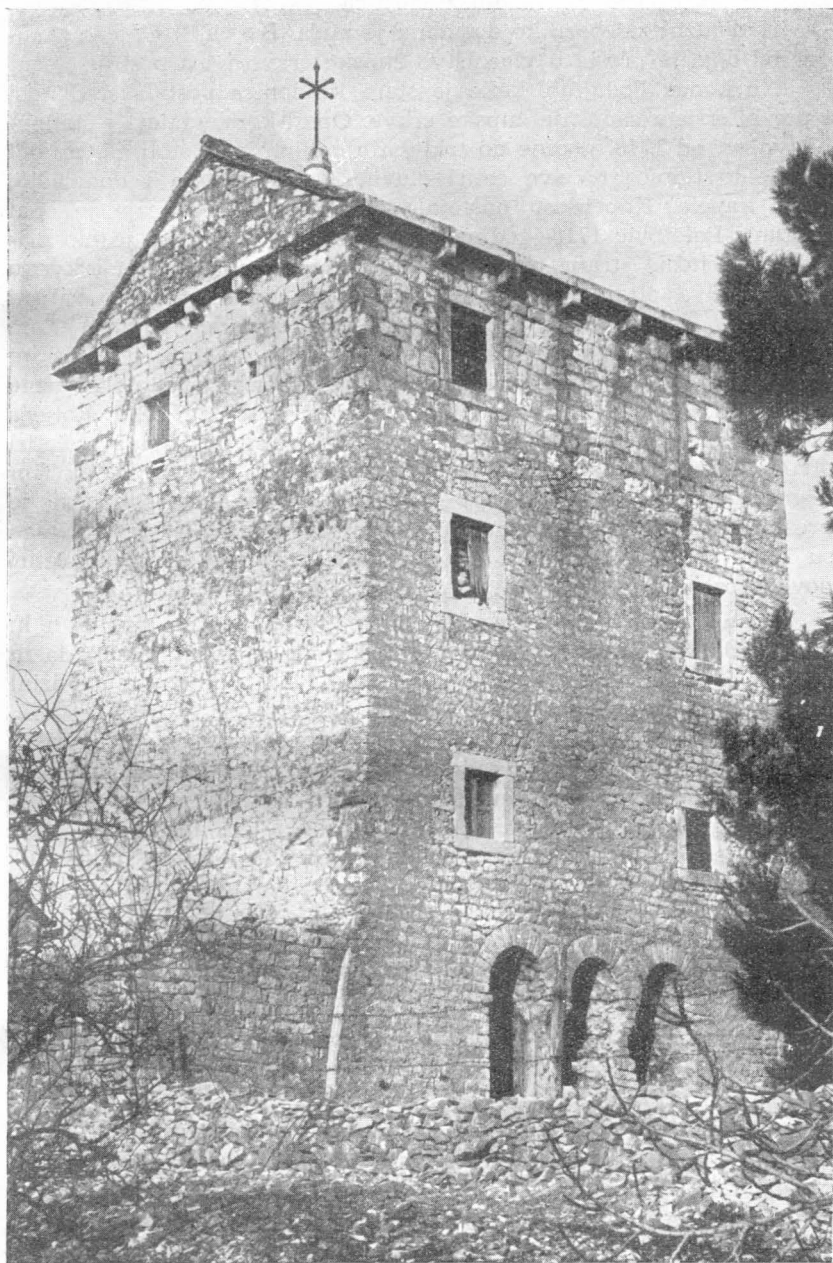
Povlja, Istočni dio starokršćanske bazilike