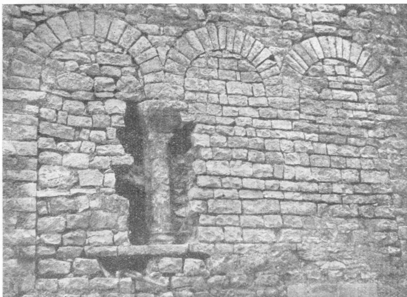
Trodijelni prozor bazilike u Poveljima