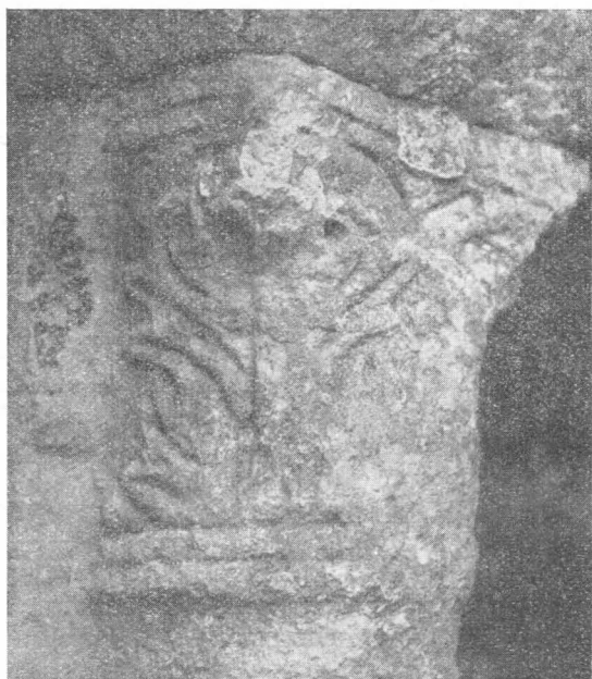
Starokrščanska glavica stupa povaljske bazilike