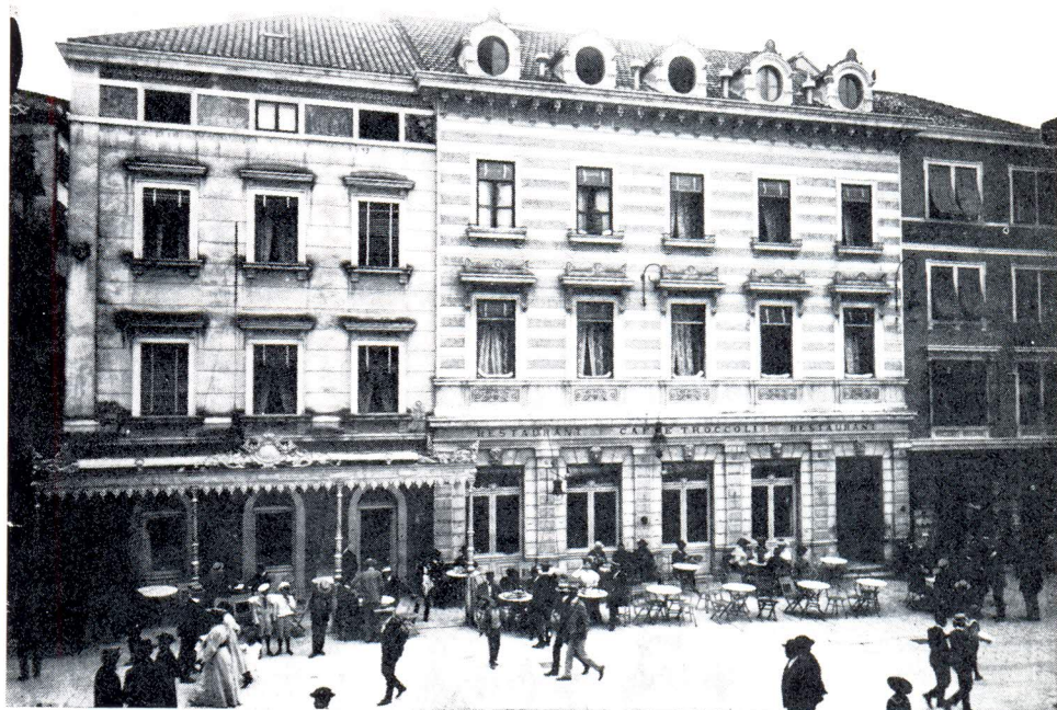
Jugoistočni dio »Gospodskog trga«, oko 1870.

I na Santinijevome planu Splita vidi se da su tu 1666. postojale dvije slijepe uličice, a ne samo jedna kao danas. 12) Također na Coroneljevom tlocrtu grada 1688. 13) i Justerovom 1708. god. 14)