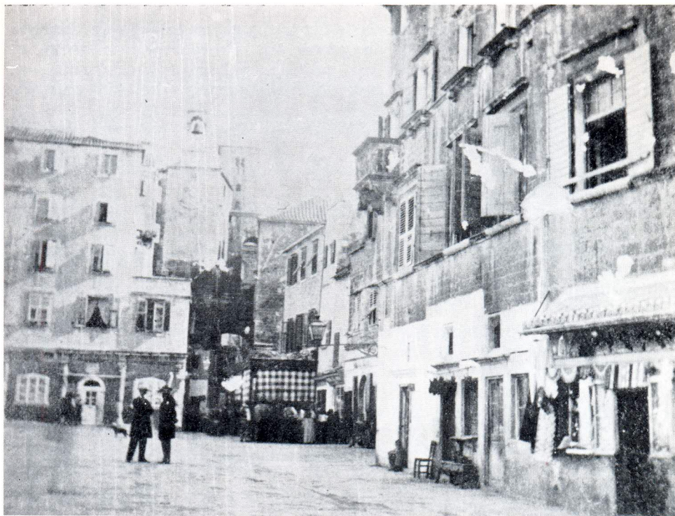
Građevni sklop, nakon obnove, s »Kafanom Troccoli«, oko 1900.

se još gotički grb stare splitske plemićke obitelji Comoli, Comuli ili Komulović: kula u štitu (bez inače uobičajene zvijezde nad kulom).