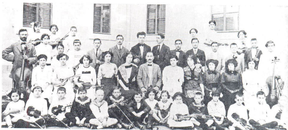
Glazbena škola A. Meneghello—Dinčić 1912.

Oslanjati se na neke sasvim čvrste i jasne podatke o ovom slučaju nije baš moguće. Kako se ipak od nečega mora početi i na nešto osloniti, vjerujemo onome u što danas jedino i možemo: ponekim kratkim opaskama u povijestima o gradu Splitu, starim povijestima glazbe, dnevnoj i periodičnoj štampi koja je pratila i bilježila rezultate i uspjehe te iznad svega privatnim zbirkami dokumenata ili usmenih predaja.