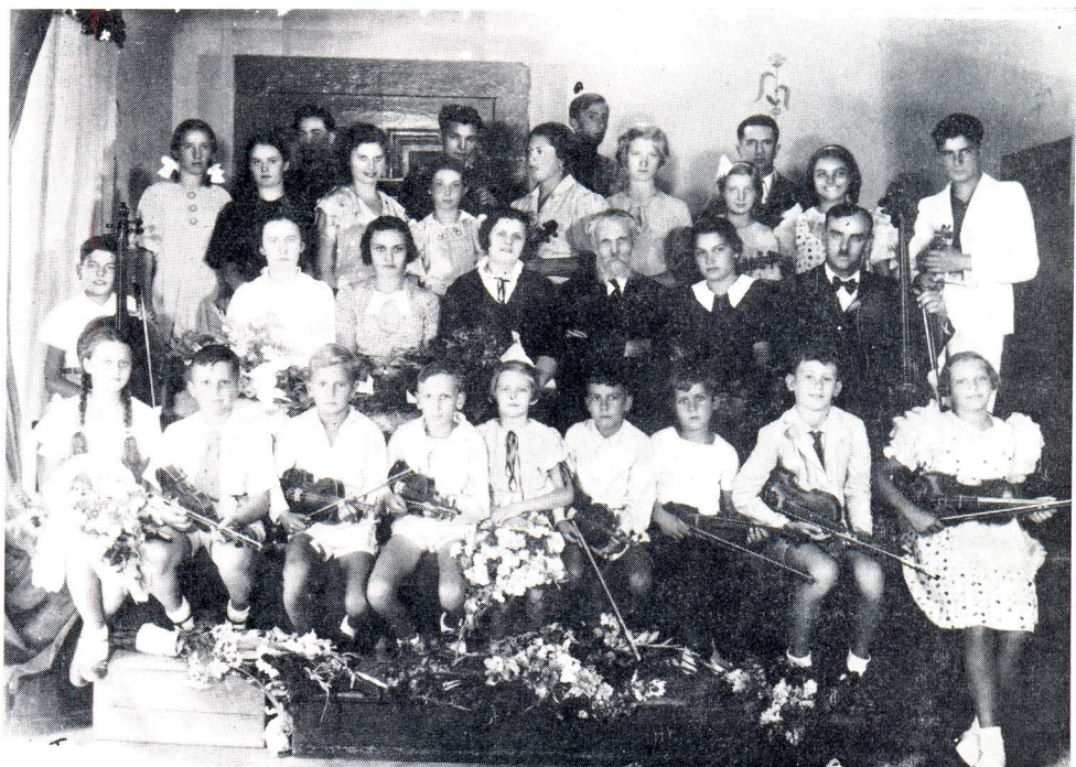
Glazbena škola »Zakladnij« 1936.

Prema raspoloživim podacima izgleda da je privatna škola Armanda Meneghella Dinčića (oko 1910), violiniste i dirigenta, bila najstarija u gradu. Nakon studija u Pesaru i rada u orkestru milanske Scale, vratio se u Split te je, uz vrlo aktivno sudjelovanje u svim granama muzičkog života grada, osnovao i svoju školu za violinu, cello, flautu, klavir i pjevanje.