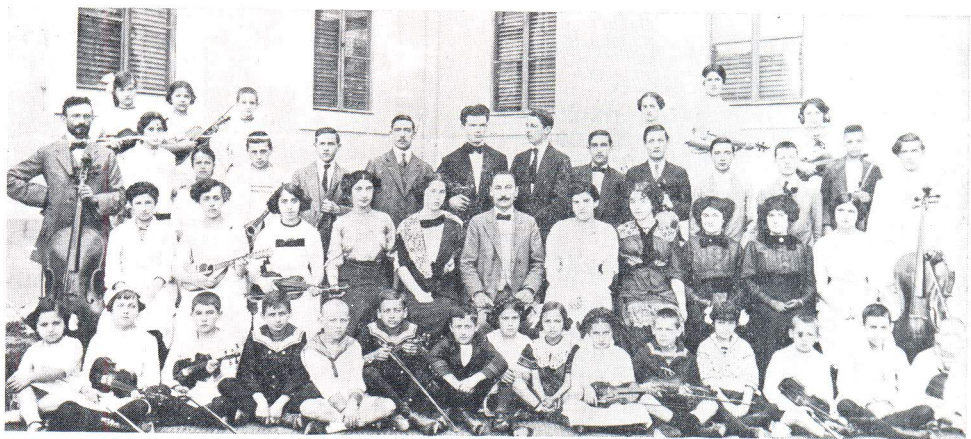
Glazbena škola A. Meneghello—Dinčić 1912.

Oslanjati se na neke sasvim čvrste i jasne podatke o ovom slučaju nije baš moguće. Kako se ipak od nečega mora početi i na nešto osloniti, vjerujemo onome u što danas jedino i možemo: ponekim kratkim opaskama u povijestima o gradu Splitu, starim povijestima glazbe, dnevnoj i periodičnoj štampi koja je pratila i bilježila rezultate i uspjehe te iznad svega privatnim zbirnama dokumenata ili usmenih predaja.