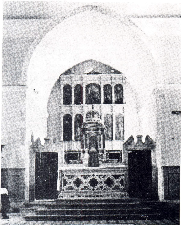
Barokni glavni oltari iz 1678.

U najnovijim preinakama unutrašnjosti crkava zbog novih liturgijskih propisa II vatikanskog sabora, ili jednostavnije rečeno, zbog postavljanja oltara prema puku, ti barokni oltari postaju žrtve tih preinaka te ih olako skidaju ili prekrajaju. Pri takvim odlukama prevladava potreba da se udovolji tim novim liturgijskim pravilima, a u isto