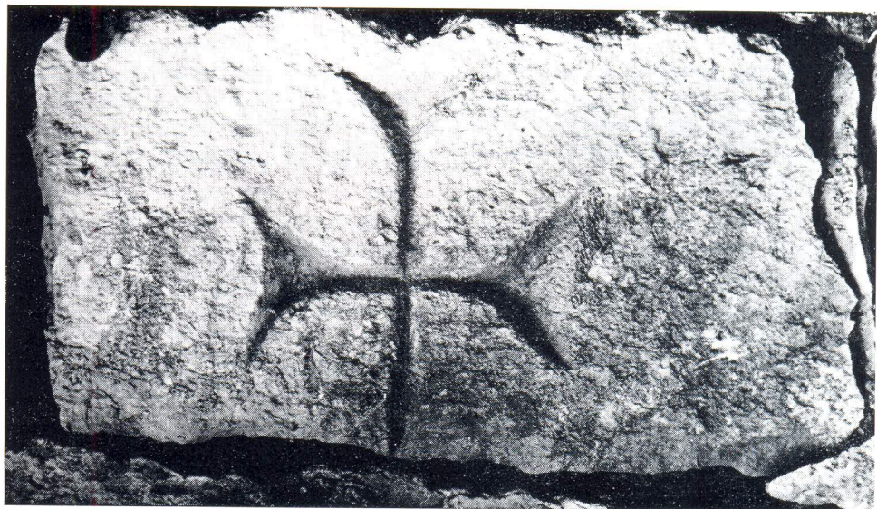
Ranokršćanski križ na Mejama u Splitu

postojanje nekog posvećenog sadržaja, obrednog mjesta. Oko njega su se pokapali članovi vjerske zajednice, postavljali njihovi sarkofazi i druge grobnice, pa i one zidane kao memorije, a tek kasnije su gradili i bazilike. Niz arheoloških tragova i spomeničkih ostataka utvrđenih na zapadnom kraju splitske Rive potkrijepljuje takvu sliku stanja i pretpostavljenog odvijanja razvoja jednog vjerskog sjedišta. Davno poznati, a sada upotpunjeni sarkofag je svojevrсни kamen temeljac, grob mučenika, koji je mogao dobiti svoj prvotni arhitektonski okvir — memoriju, kako se navodi čak dvostruku. Sudeći po nestalim natpisima uokolo bijahu grobovi običnih vjernika, a potom je podignuta crkva većih razmjera. Ostaci njenog namještaja iz kamena upućuju na 5. ili 6. stoljeće kao doba njene izgradnje, a time što je pridavanjem monumentalne krstionice svetišta proširen sadržaj i pojačana važnost