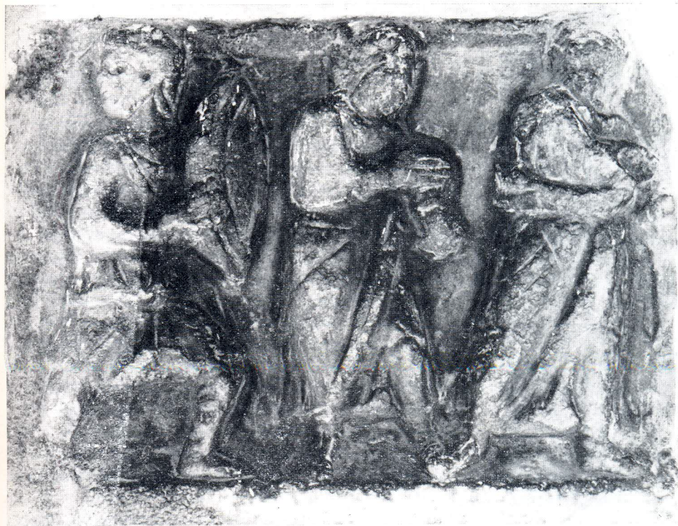
Kasnoantički reljef u dvorištu konventualaca u Splitu

i ikonografskim pojedinostima odreda nalikuju većini likova na prikazu sa sarkofaga. Na isti način su volumenski ocrtni pred udubljenom pozadinom iako se predočuju sumarniji u obliku već i zato što su znatno manji. Površina odjeće im je slično modelirana s istim grafičkim uredavanjem na zaobljenim dijelovima, a kod prikaza pojedinosti vidi se upotreba svrdla, inače svojstvena kasnoantičkom kiparstvu, i to naročito pri naglašavanju uglova usana i zjenica očiju. Uza stav tijela s blagim pokretom u poluprofilu i koračanju srodan im je i izgled lica s duguljasto ocrtnim, bademastim očima. To je naglašeno tim jače što se na ulomku veličine 33 \times 26 cm pojavljuju dva čovječja tipa, gologlavi muškarci odjeveni u toge kao i većina likova na sarkofagu Bijega Izraelaca, te oklopnik s kacigom i štitom kojemu je nošnja gotovo jednaka odori faraonovih vojnika s reljefa na pročelju spomenutog sarkofaga. Predočeni su u frizu, a istih su visina što nije zadano samo arhitektonskim kadrom nego i zamišlju cjeline. Očito je, dakle, da bi ovaj ulomak mogao biti dio spomenika koji je nastao tijekom 4. stoljeća naše ere u klesarskim radionicama Rima, poznatim u Splitu i po istodobnom sarkofagu Dobrog Pastira koji sam otkrio 1958. u crkvi sv. Duje. 11) Za nas je on utoliko