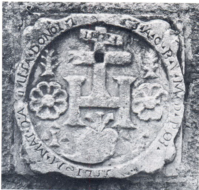
Reljef na apsidi crkve

rana, a srebrni oklop skinut. 9) Nadalje iz vizitacije biskupa Priulija doznajemo da je crkva imala posudu za blagoslovljenu vodu, tzv. škropionicu, kalež s patenom, tri korporala, misno ruho i misal. Osim toga postojalo je i zvono, vjerovatno postavljeno u mali zvonik na preslicu. Čini se da je tadašnja crkva bila mala jer je osim oltara u crkvi postojao i jedan ispred nje, pa je biskup naredio da se ukloni, 10) što je i učinjeno jer se u kasnijim vizitacijama ne spominje.