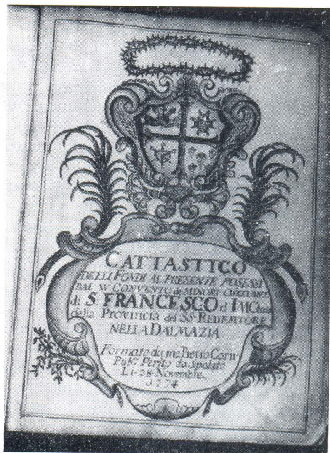
Petar Kurir: Prva i druga stranica katastra posjeda franjevacu u Imotskome

Remetin most i Žnjan. Zatim slijede zemlje u Kaštel Kambelovcu i Gomilici koji su također pripadali teritoriji Splita. U drugom dijelu su kuće i polja na teritoriji Trogira: Kaštel Vituri, Stari, Novi, Papali i Štafilić. U trećem su obuhvaćene zemlje koje je porodica Milesi dobila od Javne dobrotvornosti.