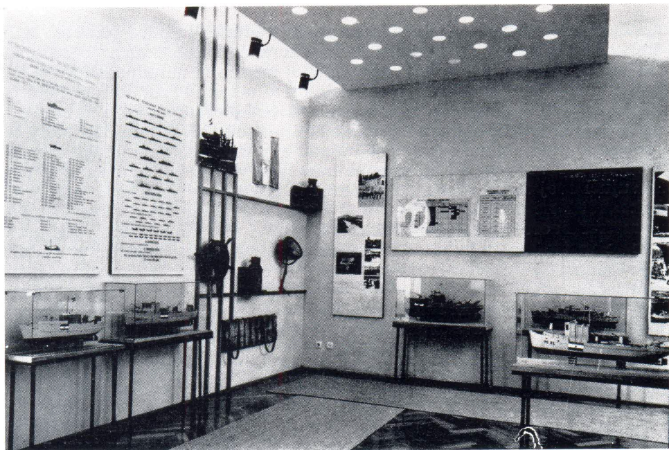
Izložci u Vojno-pomorskom muzeju

vatrena i hladna oružja. U ovoj zbirci ima djelomičnih i kompletnih uniformi koje su nosili naši borci i oficiri pripadnici Mornarice NOVJ. Tu ima veći broj oznaka činova i drugih vojnih oznaka koje su se nosile na uniformama austro-ugarskih, i starih jugoslavenskih mornara i oficira.