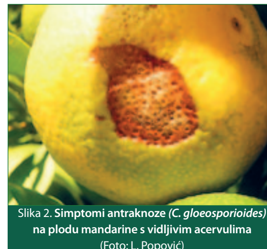
Slika 2. Simptomi antraknoze ( C. gloeosporioides ) na plodu mandarine s vidljivim acervulima

relativno čest uzročnik bolesti na mandarinama u našoj zemlji. Pojava antraknoze na mandarinama zabilježena tijekom 2012. godine pokazala je da C.gloeosporioides u Hrvatskoj može biti iznimno štetan te dovodi u pitanje neka do sada uvriježena mišljenja o ovoj gljivi.