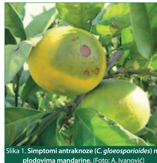
Slika 1. Simptomi antraknoze ( C. gloeosporioides ) na plodovima mandarine.