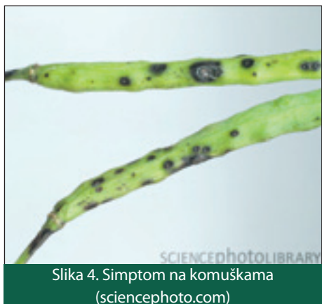
Slika 4. Simptom na komuškama

Pjege su u početku male (1 do 3 mm) i klorotične, a vremenom se povećavaju i mogu dostići 2,5 cm u promjeru. Okruglog su izgleda s više koncentričnih krugova, a ako je vrijeme vlažno, prekrivene su crnom prevlakom sporonosnih organa (konidifori s konidijama).