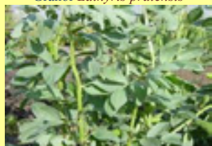
Stočni bob Vicia faba