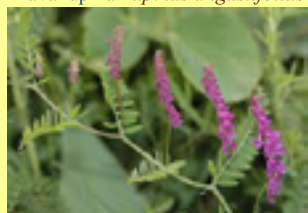
Maljava grahorica Vicia villosa