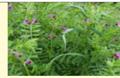
Grahorica obična Vicia sativa 1