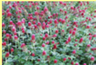
Inkarnatka Trifolium incarnatum