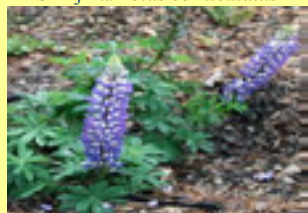
Plava lupina Lupinus angustifolius