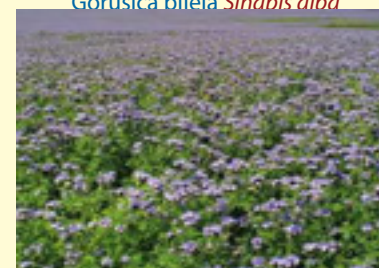
Facelija Phacelia tanacetifolia