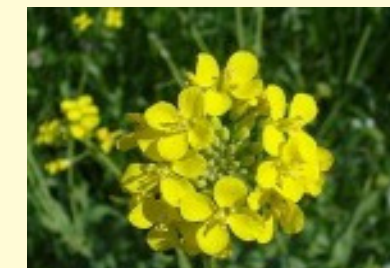
Oraštica Brassicca rapa oleifera