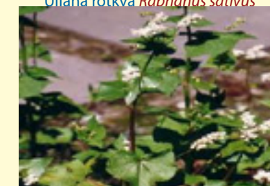
Heljda Fagopyrum esculentum