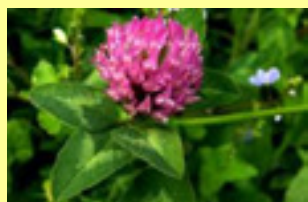
Crvena djetelina Trifolium pratense