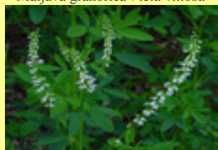
Kokotac Melilotus albus