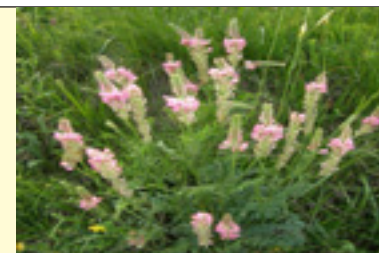
Esparzeta Onobrychis sativa