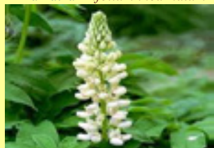
Bijela lupina Lupinus albus