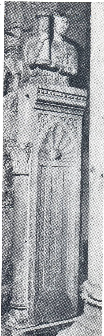
A. Aleši, ulomak oltarne pregrade, Arheološki muzej u Splitu