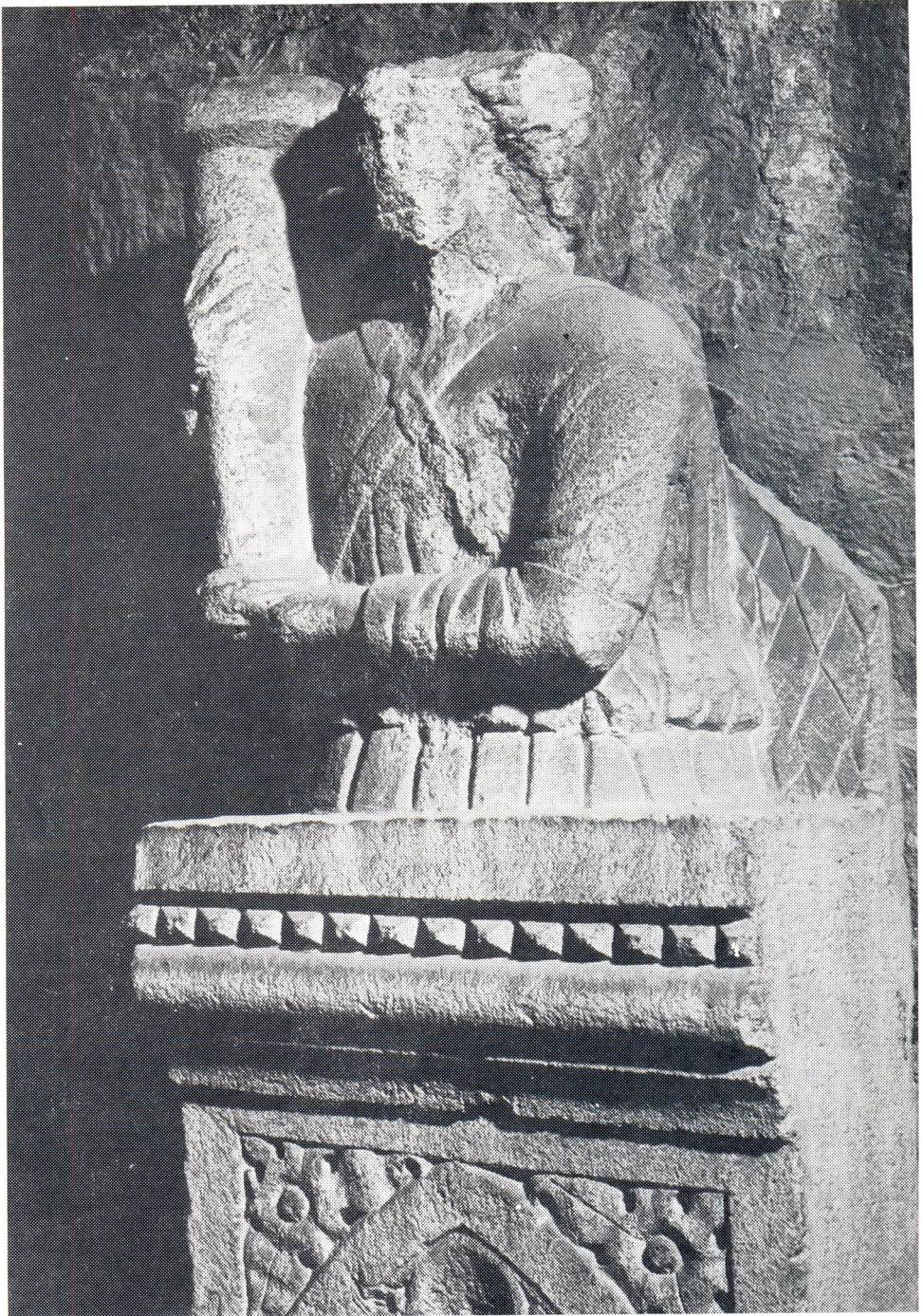
A. Aleši, ulomak oltarne pregrade, dio