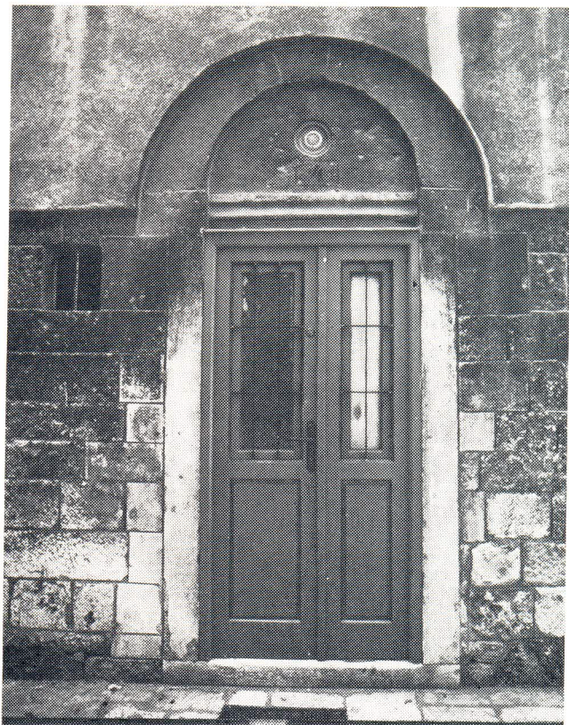
Današnji izgled ulaza crkvice sv. Anastazije