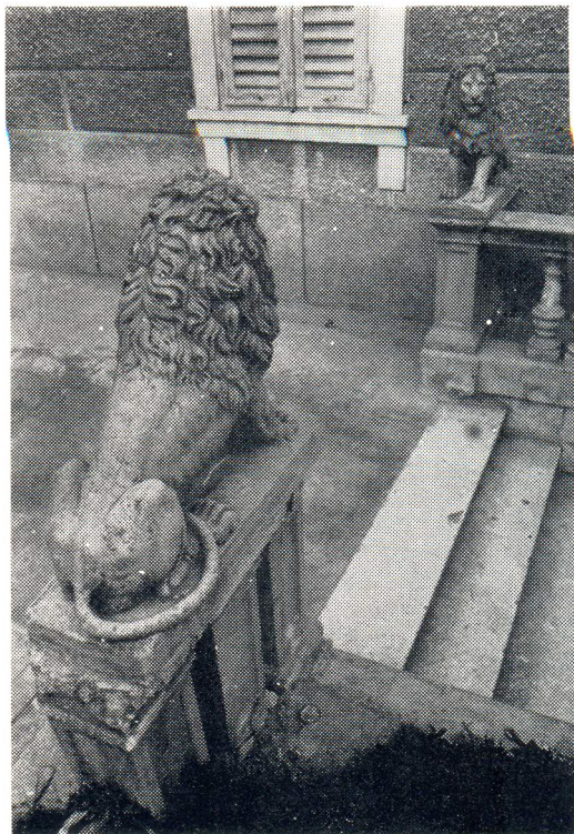
Kipovi lavova na ulazu zgrade u Ulici sinjskih žrtava 19

Tako su na Marjanu davno razbijene skulpture djevojaka koje su predstavljale godišnja doba jesen i zimu a nalazile su se na današnjem Šetalištu A. Dundića. Dosta nadgrobnih spomenika i križeva sa sustjepanskog groblja također je uništeno a tek neznatan dio prebačen na groblje Lovrinac.