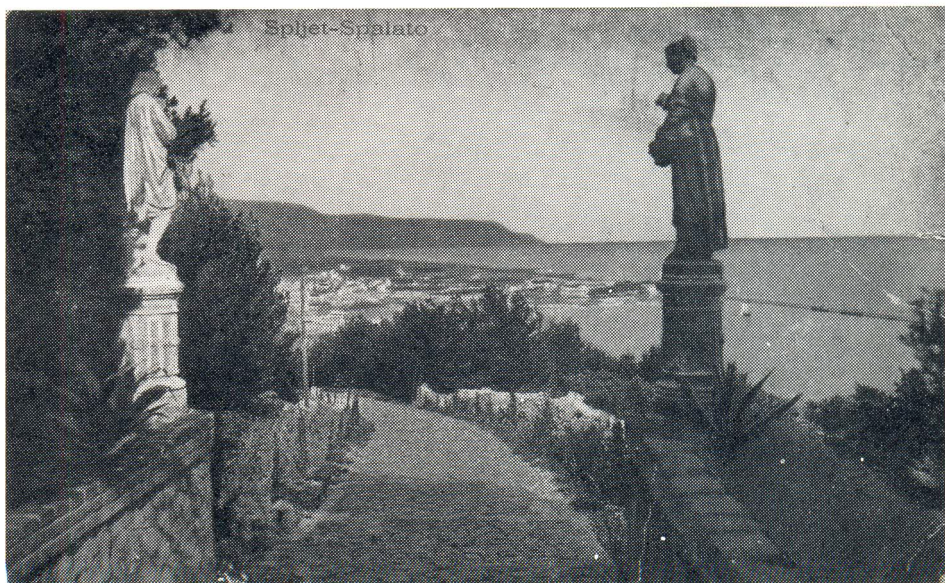
Skulpture djevojaka koje predstavljaju godišnja doba jesen i zimu, nalazile su se na današnjem Šetalištu A. Dundića na Marjanu

U Splitu, kao i u širem jadranskom pojasu, kamen je od pamtivijeka bio glavni građevinski materijal. Kamen je na ovom prostoru stoljećima bio čovjekov nezamjenjiv pratilac. Njegovo prisustvo bilo je vidljivo posvuda, bilo da se radi o kući, crkvi, mostu, zidu ili grobu.