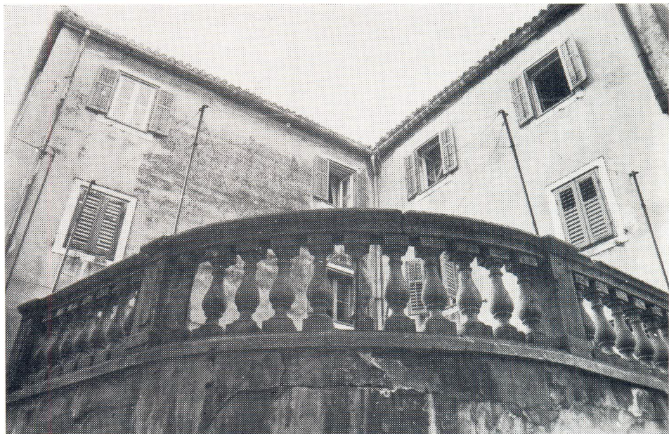
Ograda terase zgrade u Kninskoj ulici. Proizvod tvornice Bettizza

Palača Stock, kasnije Dujmović, u Zagrebačkoj 5, građena 1903. po uzoru na renesansnu palaču Vendramin u Veneciji, ima stupiće na prozorskim parapetima i druge ukrasne dijelove bolje izrade nad prozorima.