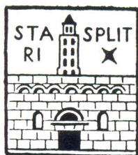
Grb društva »Za stari Split«

Split je u svojoj gotovo dvije tisuća godina dugoj povijesti stvorio ogromna kulturna dobra čija vrijednost u nekim ostvarenjima prelazi granice naše domovine. Ovo mu je nadaleko širilo glas, donijelo veliki ugled, ali i stvorilo mnogo obaveza i poteškoća jer je to blago bilo stalno izloženo propadanju. Stanovnici našeg grada su uvijek znali cijeniti nasljeđe iz prošlosti pa su tako, da bi ga bolje zaštitili, već prije sedam decenija bili osnovali prvu amatersku organizaciju na masovnoj osnovi. Uloga društva bila je tim veća što su i stručne profesionalne institucije za čuvanje spomenika bile tek u formiranju. Neposredni povod za ovaj čin bili su sukobi oko pitanja zgrade Stare biskupije.