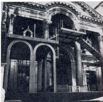
Besmislenost jedne scenografske koncepcije u povijesnom ambijentu Peristila

živi toliko koliko za nj traje interes sredine u kojoj se nalazi. Nemoguće je da spomenik živi ako nema funkcije u toj sredini. Slučaj je Peristila, na sreću, takav da ima vrlo izrazitu funkciju. Međutim, upravo zbog te svijesti o njegovoj funkciji trebali bismo se postavljati za nijansu svjesnije i ne zloupotrebljavati tu funkciju. Po mojem mišljenju, splitski festival je došao upravo u tu situaciju.