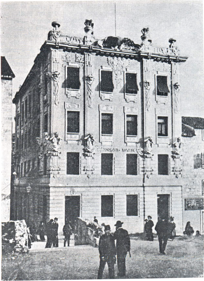
Splitske toplice 1903. (Sumporno jedno kupalište).

služećeg dobra neće smjeti da bilo na koji način direktno ili preko trećih osoba za bilo koju svrhu upotrebe, izrabe ili iskoriste žile sumporne vode da ih zatvore ili odvede na koju drugu stranu ili na korist kojeg drugog dobra a da to ne bi bilo opisano gospodajuće dobro. Pred 15. srpnja 1929. br. 165«.