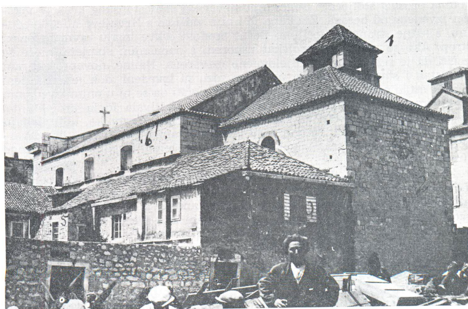
Pogled na crkvu i samostan s istočne strane (prije proširenja).

u donjim nivoima. Ova se pretpostavlja za sada nije mogla provjeriti jer bi zahtijevala postavljanje skele i skidanje žbuke, pak će to trebati naknadno provjeriti. Nacrtima barokne crkve prije proširenja nisam mogao ući u trag, kao ni projektima proširenja crkve i samostana iz tridesetih godina. U Arhivu Dominikanskog samostana sačuvane su samo 2 fotografije sjeverne i zapadne fasade novoprojektiranog crkveno-samostanskog kompleksa.