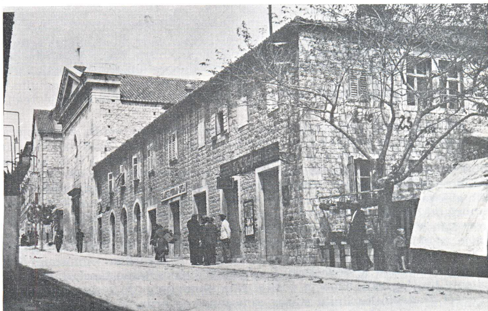
Pogled na crkveno-samostanski kompleks sa zapada (današnje stanje).

Dominikanski crkveno-samostanski kompleks je sagrađen na istočnoj strani srednjovjekovnog grada, izvan gradskih zidina, u neposrednoj blizini gradskih vrata (Srebrna vrata), na mjestu današnje glavne tržnice (pazara). U antičko vrijeme je na tom prostoru vjerojatno bila sagrađena starokršćanska crkva sv. Katarine, u srednjem vijeku (13. st.) gradi se domi-